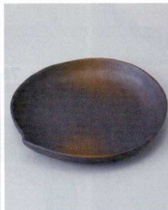
196-303-60 1,100円 うでいりーフェケーキ皿 (20.7×19.2×3) 519450460