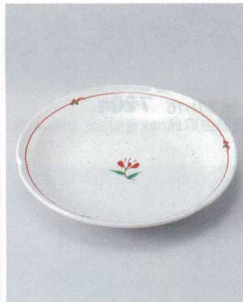
196-305-47 1,000円 粉引釉赤絵なごみ7.0皿 (22×3.7) 519510347