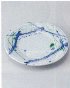
196-204-34 1,650円 二色押6.3皿 (19.3×2.3) 519430234