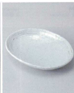
196-402-25 1,000円 錆渦22cm楕円皿 (22×16.5×4) 519510125