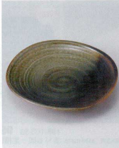
196-103-25 2,300円 黒いぶし三ツ足6.5皿 (21×3.2) 510720325