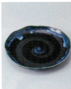
196-301-35 1,350円 唐草流雲型7.0皿 (21.5×3) 519440135