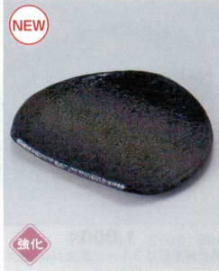
196-105-73 2,200円 黒緑彩半月天皿 (21.3×18.5×2.5) 619610573