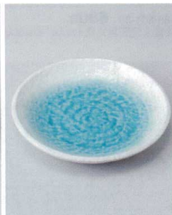
196-405-79 900円 白流水7.0丸皿 (19.5×2.6) 519520277