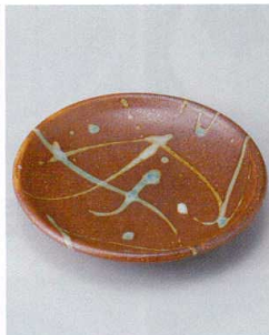
196-203-78 1,950円 潮吹玉淵6.0丸皿 (18.8×3.1) 519420378