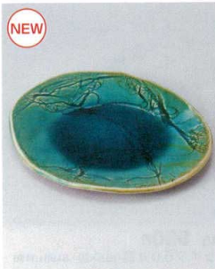
196-101-16 3,200円 深海ブルー楕円皿 (20.8×18×1.8) 619610116