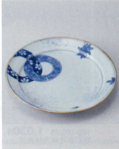
196-104-35 2,250円 染付春秋丸紋6.5皿 (20×2.8) 519410335