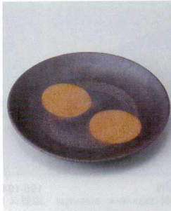
196-102-7 2,800円 黒南蛮7.0皿 (21.7×3) 519410207