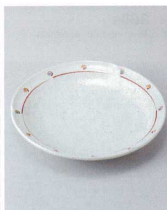
196-401-47 1,000円 きらら7.0皿 (22.3×3.5) 519510447