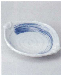
196-202-51 1,950円 清瀬 芳醇手付鉢(大) (23.3×18×3.3) 519420451