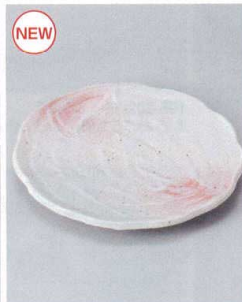
196-304-16 1,050円 桜志野丸60皿 (19.5×2.4) 619630416