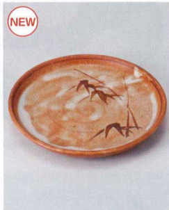
196-205-30 1,400円 赤志野竹 6.5皿 (19.8×2.7) 619620530