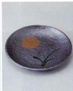
196-302-76 1,200円 おぼろ月7.0丸皿 (20×3) 519450176