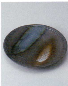
196-201-51 2,100円 雲海芦丸6.0皿 (20.5×2.5) 519810451