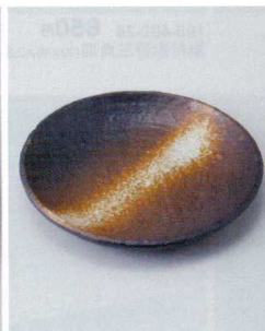
196-404-79 900円 黒備前7.0丸皿 (20×2.5) 519520177