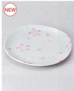
197-204-58 470円 白雪桜7.0皿 (20.7×2.3) 619720458