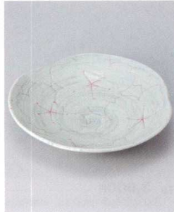
197-101-28 630円 ゆかり 7.0深皿 (21.5×4.6) 619710128