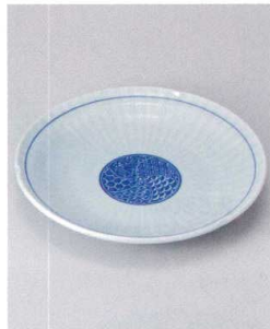
197-201-28 590円 淡青祥瑞 7.0皿 (22×3.6) 619720128