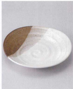
197-203-15 500円 灰釉掛分 6.5深皿 (20.8×3.8) 519540215