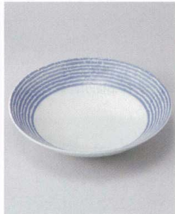
197-305-28 400円 スタイル7.0浅鉢 (21.8×4.8) 519750628