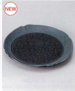
197-105-58 470円 黒釉ライン桜7.0皿 (20.8×2.3) 619710558