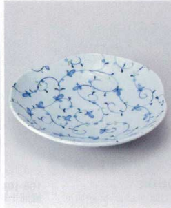
197-102-28 630円 つぼみ唐草 7.0深皿 (21.5×4.6) 619710228