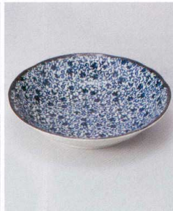
197-302-28 420円 益子唐草 7.0深皿 (21.6×4.7) 619730228