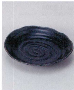
197-401-61 380円 古陶 6.5皿 藍 (20.3×19.2×3.3) 619740161