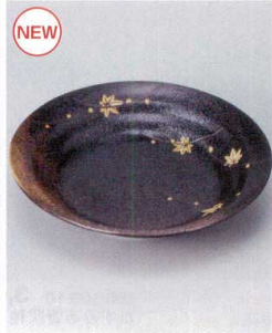
197-103-51 550円 紅葉6.5深皿 (20×4) 619710351