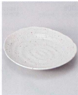
197-402-61 380円 古陶 6.5皿 白 (20.3×19.2×3.3) 619740261