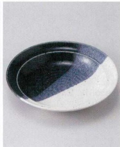
197-205-60 460円 石彩おでん皿 (20×3.8) 519540360