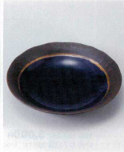
197-104-76 520円 インディゴブルースープ皿 (21×4.2) 519540176