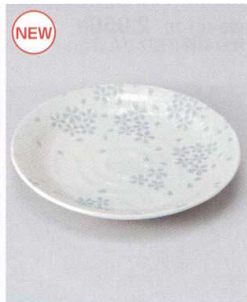
197-405-40 370円 ハスイ桜 6.0皿 (19.2×2.8) 619740540