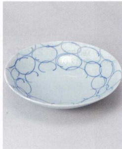
197-304-28 420円 まんまる 7.0深皿 (21.6×4.7) 619730428