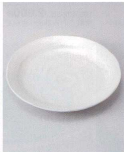
197-404-40 370円 クラフト粉引6.0皿 (19.2×2.8) 519930440