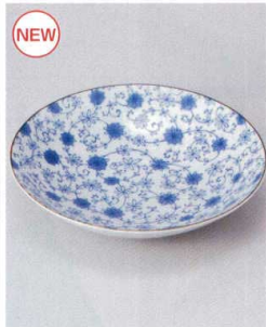
197-303-28 420円 芽吹き唐草 7.0深皿 (21.6×4.7) 619730328