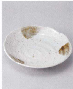
197-202-60 520円 白唐津釉古陶6.5皿 (20.2×3.9) 519530460