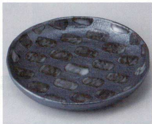
198-404-46 1,900円 黒市松バスタ皿(22.7×3.4) 519650146