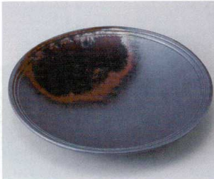
198-102-25 3,000円 いぶし7.0皿(23×3.2) 519620125