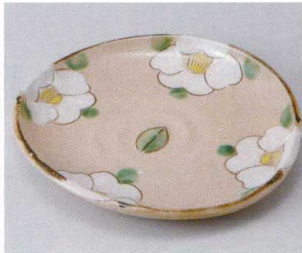
198-303-52 2,200円 織部椿たわみ大皿(23×22×2.3) 519630352