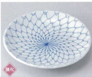
198-401-70 2,050円 青白磁網花型7.0丸皿(21.3×3.4) 519420171