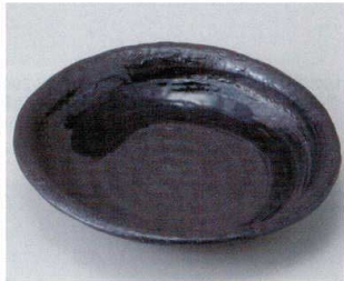
198-304-35 2,050円 大和たわみ鉢(22.8×22×4.5) 519640335