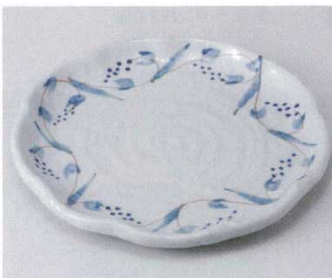
198-201-78 2,850円 唐津8.0丸皿(24×2) 519620278