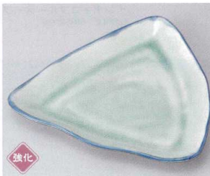
198-202-70 2,650円 御深井三角盛皿(22.5×22.5×2.2) 520510171