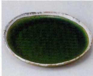
198-104-75 3,000円 織部十草 8.0丸皿(24.2×23.4×2.5) 519610575