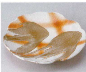
198-501-35 1,880円 ひだすぎ花型8.0皿(24.3×24×4.5) 519650235