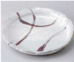
198-302-35 2,200円 香気7.0深皿(23×3.5) 519630435