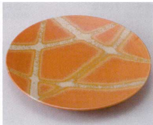
198-204-35 2,550円 伊賀火色7.5皿(22.7×3.2) 519630135