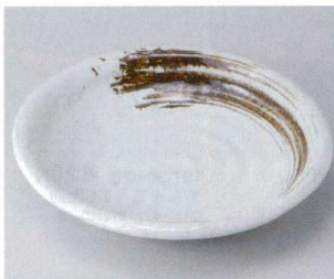
198-402-35 2,000円 武蔵たわみ鉢(23×22×4.5) 519640435