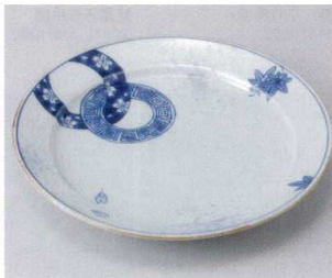
198-203-34 2,580円 染付春秋丸紋7.5皿(23.4×3.1) 519620434