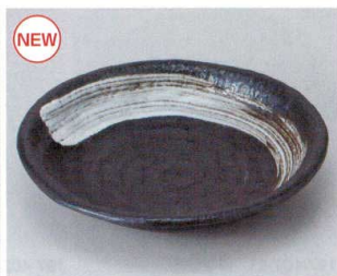
198-504-62 1,800円 白ハケ天目 煮物鉢(22.5×21.5×4.5) 619850462