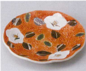
198-101-70 3,540円 赤濃山茶花7.0丸皿(21.8×3.3) 519410171