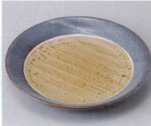
198-103-10 3,000円 ねずみ志野灰釉7.0皿(21.5×3) 519610410