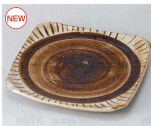
198-502-35 1,850円 サビ十草 正角皿(21.5×21×2.7) 619850235