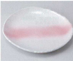
198-301-78 2,350円 彩時空・夢7.5楕円皿(22.6×20.5×2.8) 519410477