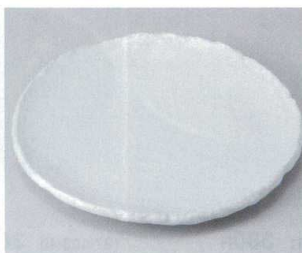
198-503-35 1,800円 蔵間濃8.0皿(25.5×3) 519710135