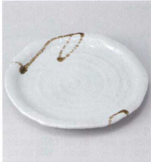
201-103-62 1,500円 風雅8.0波皿(24.5×2.5) 519920162 201-104-62 870円 風雅7.0波皿(20.5×1.5) 519920262