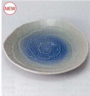
NEW 201-108-51 1,500円 コロナ三角9.0皿(27×27×3.5) 620110851 201-109-51 680円 コロナ三角6.0皿(20×20×3) 620110951 201-110-51 430円 コロナ三角5.0皿(16×16×2.5) 620111051