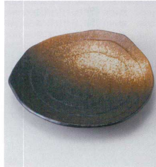
201-401-15 680円 黒備前三角6.0皿(19.5×3.2) 519940415 201-402-15 420円 黒備前三角5.0皿(16.3×2.7) 519940515