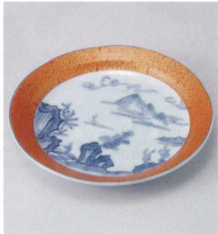
201-208-17 1,000円 金彩山水8.0皿(24×3.2) 519940817 201-209-17 650円 金彩山水6.0皿(19×2.7) 519940917