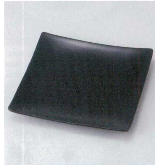
201-301-73 1,000円 黒6.0正角皿(17.8×18×2.7) 519840773 201-302-73 740円 黒正角銘々皿(13.6×13.6×2.1) 519840873