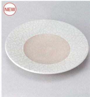
NEW 201-203-51 1,100円 輪二重8.0寸皿(24.8×3.7) 620120351 201-204-51 620円 輪二重6.5寸皿(19.5×3.2) 620120451 201-205-51 420円 輪二重4.8寸皿(14.3×2.7) 620120551