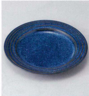
201-303-62 900円 雲海10吋ディナー皿(26.5×3) 519930562 201-304-62 600円 雲海9吋ミート(23×2.8) 519930662