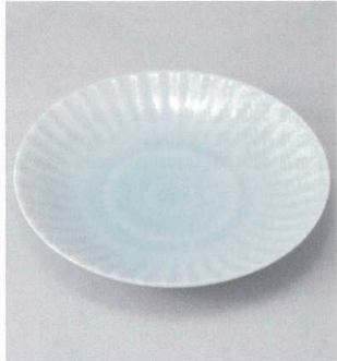
201-307-40 730円 青白磁6.0皿(19×3) 519940140 201-308-40 430円 青白磁5.0皿(14.7×2.5) 519940240 201-309-40 310円 青白磁4.0皿(12.2×2) 519940340