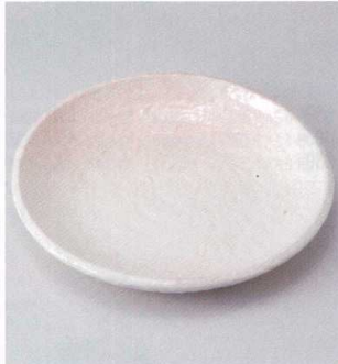
201-305-79 900円 桜志野7.0丸皿(20×20) 519930777 201-306-73 550円 桜志野5.0丸皿(15×2.5) 519930873