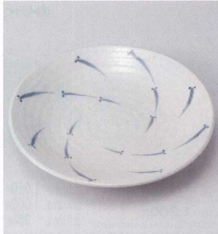
201-105-33 1,500円 手描メダカ7.0皿(22.3×3.5) 519920333 201-106-33 1,150円 手描メダカ6.0皿(20.5×2.8) 519920433 201-107-33 650円 手描メダカ5.0皿(16.3×2.8) 519920533