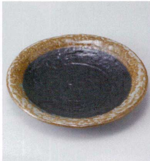
201-206-56 1,050円 おぼろ夜石目7.0皿(23×3.5) 519930156 201-207-56 530円 おぼろ夜石目5.0皿(16.3×2.5) 519930256