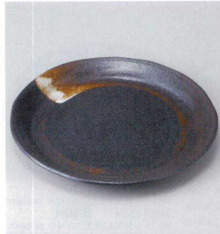
201-101-46 1,500円 黒結晶24cm皿(24.2×2.5) 519720446 201-102-46 1,090円 黒結晶21.5cm皿(21.2×2.3) 519720546