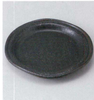
201-201-51 1,200円 天正黒玉測ヶ一キ皿(20.3×20.3×2.6) 519440351 201-202-51 700円 天正黒玉測取皿(17.7×17.7×2.6) 519440451