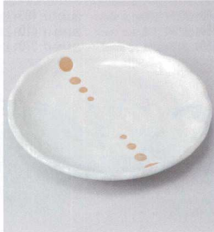
201-406-57 460円 淡雪ドット7.0皿(22×2.8) 519940657 201-407-57 350円 淡雪ドット5.0皿(16×2) 519940757