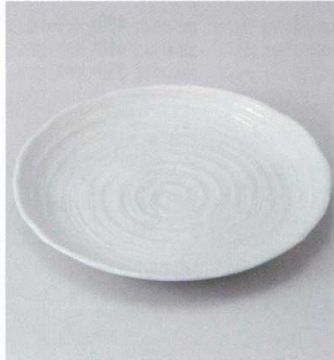
201-403-58 620円 吉祥粉引8.0皿(24.5×2.8) 519750258 201-404-58 400円 吉祥粉引7.0皿(21.8×2.4) 519750358 201-405-58 300円 吉祥粉引5.0皿(16.4×2) 519750458