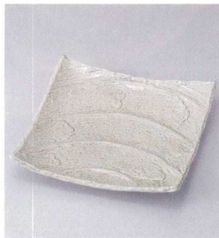
207-301-51 2,500円 ヒワ極み正角皿(大)(22.5×2) 520530151 207-302-51 1,350円 ヒワ極み正角皿(小)(18.5×2) 520530251