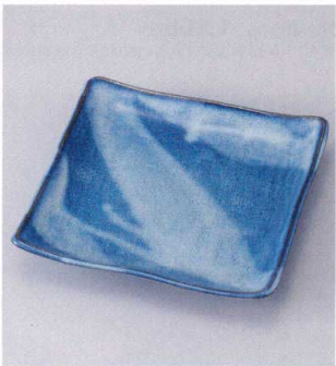
207-402-62 920円 均窯正角皿(18×18×3.5) 520740262