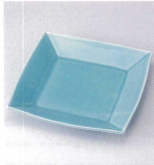
207-101-25 1,280円 青磁角大皿(20.5×20.5×3.2) 520710125