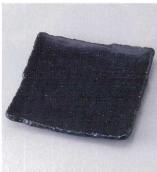
207-203-35 1,260円 凜正角皿嵐山(19.7×19.5×3) 520720335