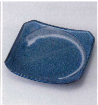
207-404-54 730円 十六夜角8.0皿(19×19×2.5) 520740454