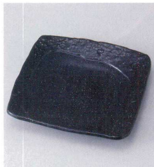
207-201-35 1,280円 黒石目6.0角皿(18×18×3.3) 520720135