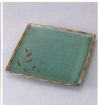
207-305-40 1,140円 グリーン芦角大皿(23×23×3) 520730440