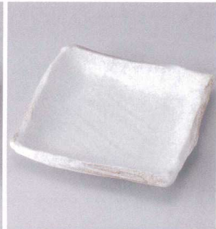
207-104-24 1,300円 匠正角皿小(18.5×18.5×3.6) 520710424