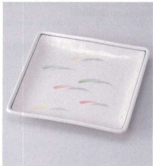
207-401-73 1,040円 むさしの6.0正角皿(17.5×17.5) 520740173