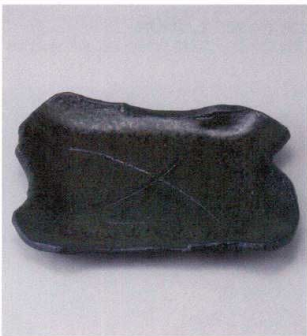
207-403-35 3,150円 手造り窯変黒変型皿(25.5×21×4.5) 520320135