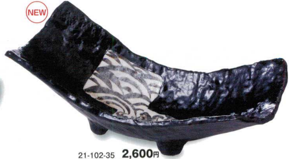
21-102-35 2,600円 黒織部青梅波向付(21×14×9) 602110235