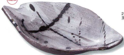
21-301-5 2,050円 黒流し変形鉢(手造り)(21×13.5×4) 602130105