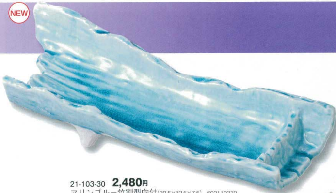
21-103-30 2,480円 マリンプルー竹割型向付(30.5×12.5×7.5) 602110330