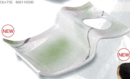
21-202-35 2,750円 丸抜き長皿ヒワ(21×13×6) 602120235