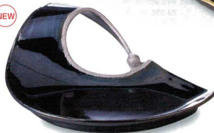
21-302-35 2,750円 黒アメ釉アーチ型向付(20.5×15.8×6.5) 602130235