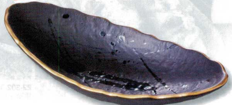
21-203-5 2,400円 測金黒釉舟型8.5鉢(25.7×12×5.2) 602120305