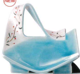
21-303-35 2,100円 青白角面取小鉢(15×12×7.5) 602130335