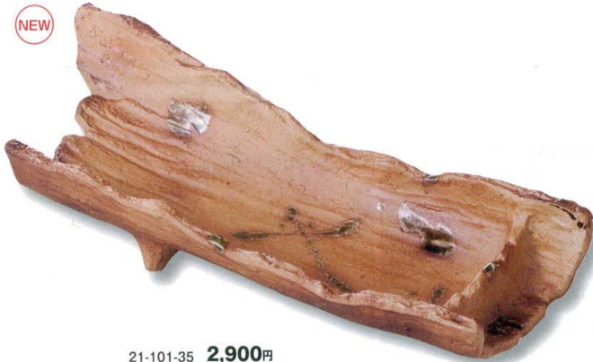
21-101-35 2,900円 焼き締めビード口落し竹割型(30×13×8) 602110135