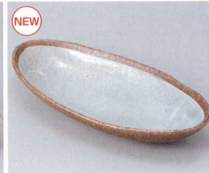
210-403-25 1,700円 伊賀化粧長盛鉢 (29.5×14.3×4.8) 621040325