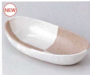
210-501-74 2,800円 唐津化粧楕円盛鉢 (28×14.3×6.3) 621050174