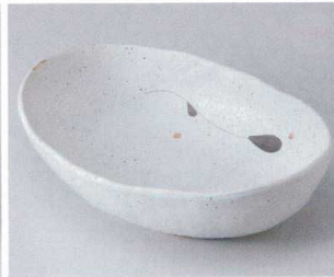
210-302-26 1,800円 粉引めばえ楕円鉢 (23.5×17×6.5) 521050426