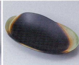
210-204-82 1,800円 9.0鉄織部多用鉢 (29×18×4) 521030482