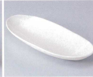
210-404-16 1,200円 クリーム長盛皿 (32×13.5×4) 521140116