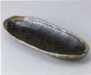
210-101-56 2,450円 おぼろ夜石目長皿(大) (33.2×14.8×4) 521020156