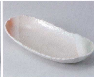
210-203-78 2,350円 彩時空・虹10.0小判長鉢 (30.5×14.0×5) 521020477