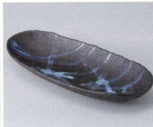
210-202-61 1,900円 黒釉桂川舟形盛鉢 (33.4×14.2×4.3) 521030361