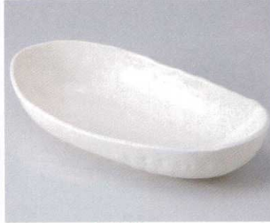
210-102-63 2,300円 ゆらぎ楕円盛鉢 (30×16×6) 521020263