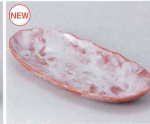
210-503-16 1,900円 赤彩長盛皿 (31.7×15×4.5) 621050316