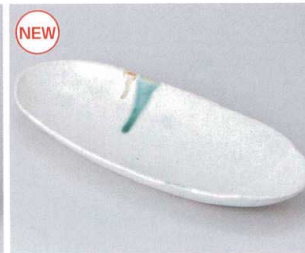
210-502-51 1,300円 オリベ二彩石目小判皿(大) (32.7×13.8×4) 621050251