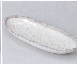
210-402-35 1,300円 白唐津 舟型鉢 (32.5×13×5) 621040235