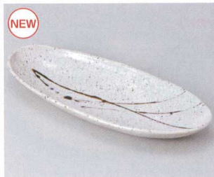
210-401-16 1,200円 肌しずく長盛皿 (32×13.5×4) 621040116