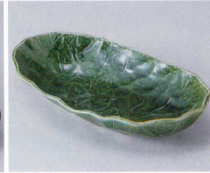
210-304-51 1,600円 手折織部楕円多用鉢 (29.3×16.7×4.5) 521040451