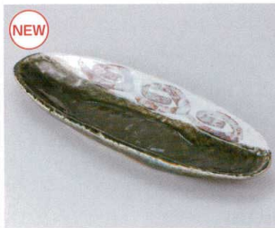
210-301-73 2,930円 織部ライン舟型盛鉢 (35.5×14×4) 621030173