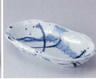
210-104-34 3,000円 呉須とばし楕円鉢大 (27×15×5.5) 521010434