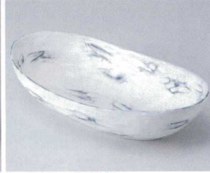
210-103-16 3,300円 化粧流楕円盛鉢 (30×16×7) 521010216