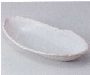
210-201-31 2,150円 窯変桃山長盛皿 (32.6×15.5×4) 521030231