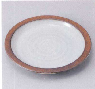
213-101-5 3,200円 粉引白うのふ8.5吋パスタ皿(26.5×3.5) 521320105