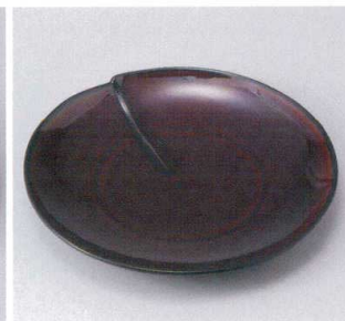
213-304-52 2,750円 うるし釉ハス大皿(24.3×3.3) 521340352