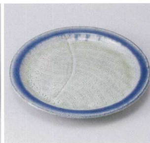
213-303-25 2,800円 カライギン目ツバ8.0皿(23.5×2.9) 521340225