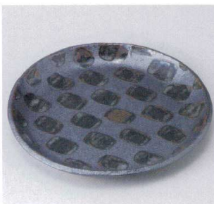
213-202-46 3,100円 黒市松9.0丸皿(26.7×3) 521320246