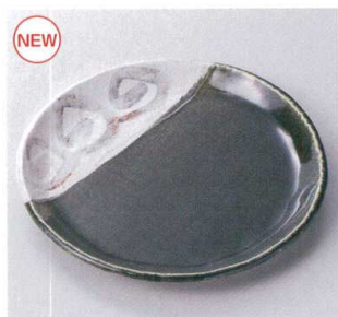
213-201-73 3,350円 織部ライン9.0丸皿(26.6×2.7) 621320173