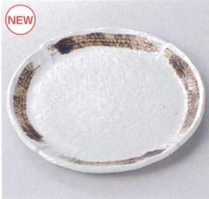
213-102-70 3,150円 粉引茶刷毛丸9.0皿(28.5×2.4) 621310270