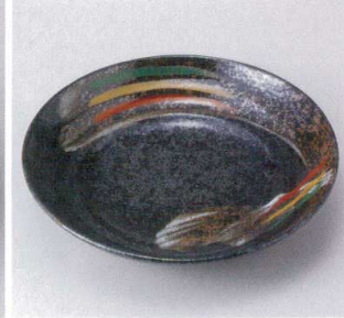
213-104-5 2,700円 荒刷毛三彩9.5皿(28.7×6) 521340405