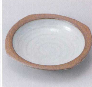
213-103-5 2,950円 粉引白うのふリム付カレー(24×22.5×4.5) 521330305