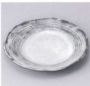
213-302-5 2,850円 粉引くしめ8.0皿(25×3) 501120205