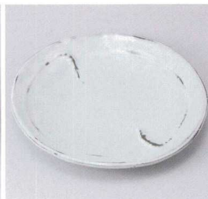
213-203-25 3,000円 粉引8.0深皿(24.5×24×3.8) 521320325