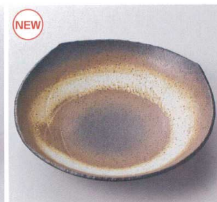
213-404-25 1,470円 黒備つゆ草8.0浅鉢(24×24×5.5) 621340425