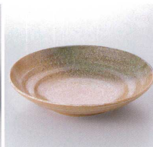
213-403-63 1,700円 信濃路9.5浅鉢(28.5×6) 523340263