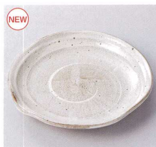
213-401-33 1,420円 渦刷毛片口大皿(22.5×22×5) 621340133