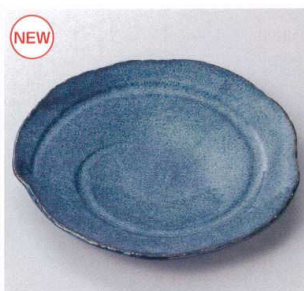
213-402-35 1,800円 藍の雪波型9.0皿(28×27.5×2.7) 621340235