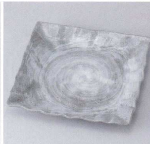
214-103-57 2,600円 青磁刷毛目手折り正角大皿(26×26×3.5) 521420257