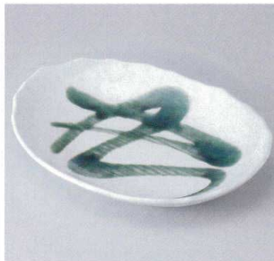
214-302-30 1,850円 白マツ織部散し大皿(27×20.4×5) 521440130