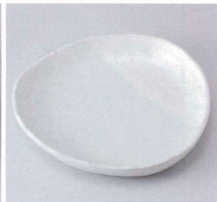
214-204-25 2,000円 白釉砂目三角大皿(25×25×3.5) 521430425