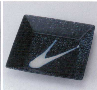
214-104-62 2,550円 銀彩黒23cm角鉢(23.5×23.5×4.5) 521420162