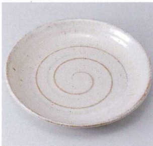
214-201-26 2,600円 乳白8.0プレート(25.3×3.5) 521410426