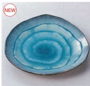
NEW 214-403-35 1,750円 藍染スカイ 三角9.0皿(26.5×26.5×4) 621440335