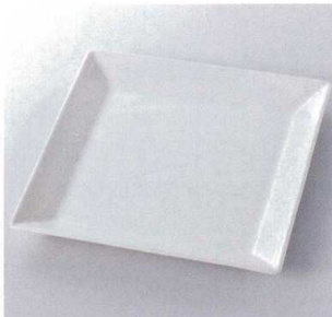
214-101-78 2,950円 白一珍角大皿(25×25×2.5) 521410178