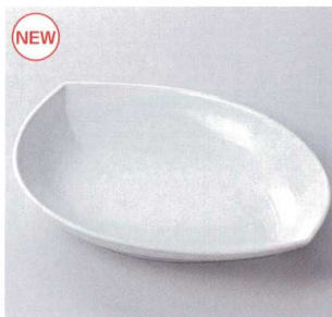
NEW 214-402-35 3,050円 ミルキーホワイト大鉢(30×22.5×5) 621440235