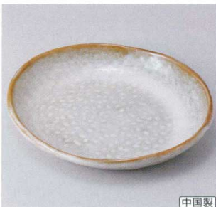
214-401-51 1,600円 かすみ野7.5楕円深皿(23×20.7×4) 519640251