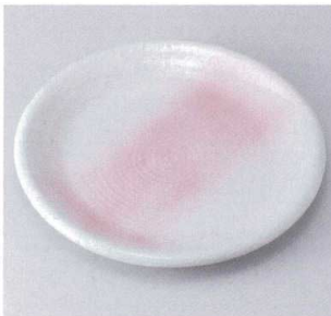
214-301-78 2,800円 彩時空・夢8.0丸皿(24.3×2.4) 521410377