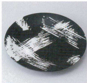
214-303-1 1,800円 黒地白刷毛尺皿(28×3.5) 521440301