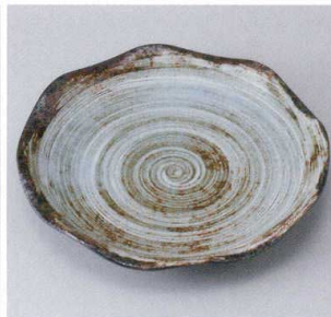
214-203-16 2,200円 白刷毛均窯花型80皿(24.8×3.7) 521430216