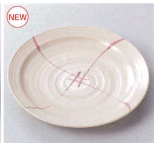
NEW 214-404-25 1,150円 粉引赤筋8.0皿(25.7×3.2) 621440425