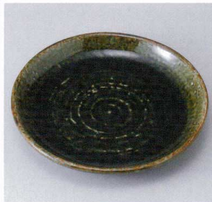
214-202-62 2,000円 織部砂目7.0丸皿(23.5×3.5) 521430362