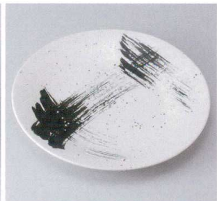
214-304-1 1,800円 白地黒刷毛尺皿(28×3.5) 521440401