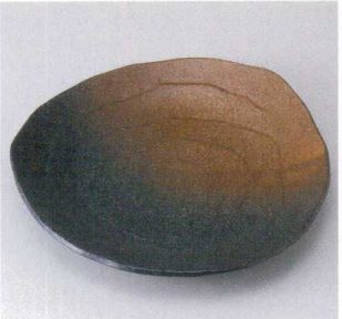
215-203-15 1,500円 黒備前三角9.0パスタ皿(26.8×4) 521520315