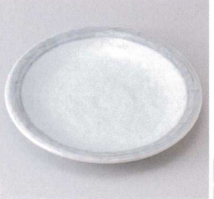
215-104-25 1,700円 うす雪石目8.0皿(25.5×3.5) 521510425