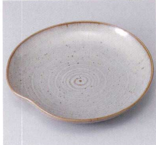
215-101-62 1,900円 白うのふほのか23cm大皿(23×23×3) 521510162