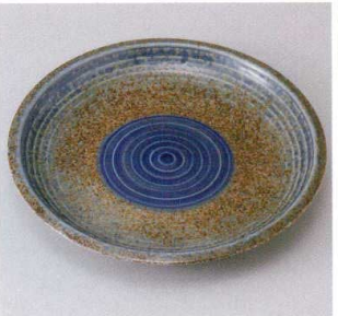
215-405-24 890円 藍流し8.0皿(25×3.5) 521640124