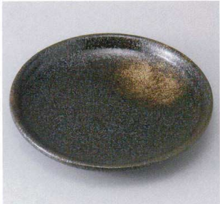
215-302-24 1,450円 グリーン油滴パスタ皿(23.2×3) 521540224