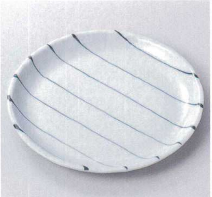
215-303-47 1,850円 ストライプ7.0皿(21.5×2.2) 621530347