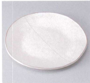
215-201-35 1,600円 しらたま大皿(27×2.8) 521520135