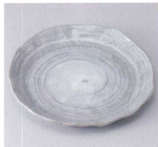
215-401-57 1,500円 青磁刷毛目手折り丸大皿(25×24.5×3) 521540157