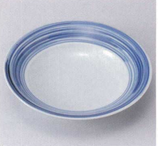
215-103-34 1,450円 瀬呉須刷毛目7.5パスタ(22.5×4.5) 521540334