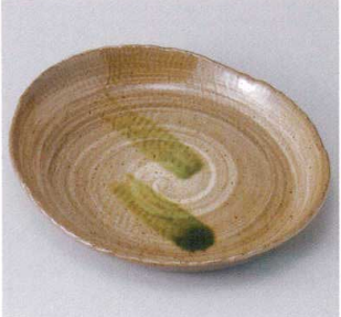
215-102-51 1,600円 黄瀬戸オリベちぎり大皿(25×21.7×3) 521510251