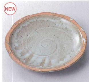
215-301-74 3,200円 舞羅土8.5丸皿(26×4) 621530174