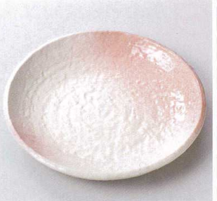
215-304-47 980円 桜志野7.0丸皿(20×3) 621530447 215-305-47 550円 桜志野5.0丸皿(15×2.5) 621530547