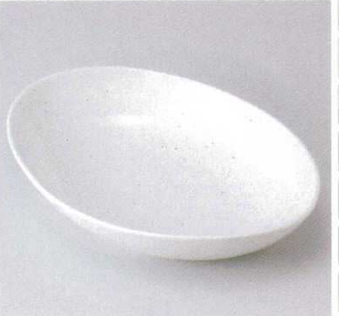
215-204-35 1,350円 粉引楕円深皿(27×19.3×5) 521540435