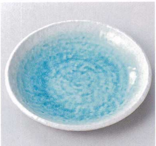
215-404-47 980円 白流水丸7.0皿(19.8×2.7) 621540447