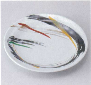
215-202-5 1,550円 三色彩8.0パスタ皿(24.3×3) 521520205