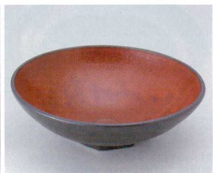
218-504-35 5,000円 手造りジャバナスク7.0鉢(21.5×7) 521840435