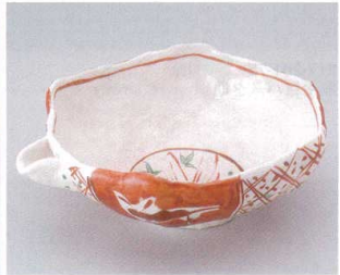
218-304-35 4,400円 赤絵間取片口8.0鉢(24.3×19.4×8.5) 521920235