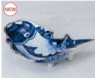
218-303-75 4,500円 染付なまず鉢(19.4×14×6.6) 621830375