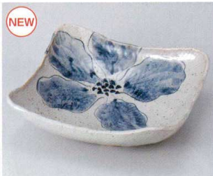
218-201-46 8,000円 ひし葉 8.0角鉢(23×23×8) 621820146