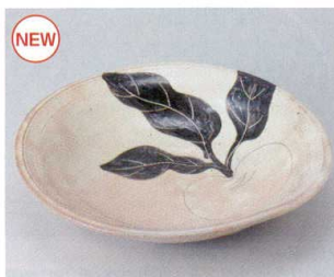
218-502-57 5,300円 黄粉引カブラ8.0盛鉢(24×5.5) 621850257