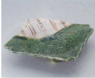
218-103-56 8,000円 織部三つ足十字鉢(23×5) 521810456