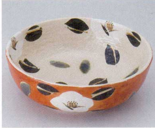
218-102-70 8,250円 赤濃山茶花盛鉢(22×7.4) 522410171