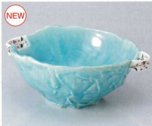
218-301-35 5,000円 青白外面取盛鉢(24×19×9.5) 621830135