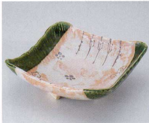
218-202-70 6,960円 織部10.0角鉢(24.2×23×9.1) 521820271