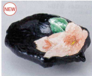
218-203-75 5,400円 黒織部芙蓉 片口平鉢(26×22×7.5) 621820375