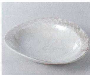
218-503-46 4,600円 粉引櫛目タ円盛皿(27×26×6.3) 522610446