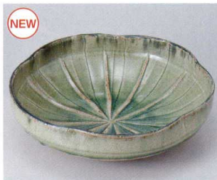
218-402-70 6,200円 御深井花型大鉢(24.5×7.4) 621840270