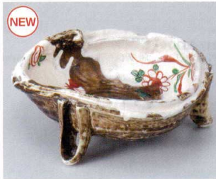
218-302-75 5,000円 赤絵万暦 三ツ足鉢(19.7×18.5×7) 621830275