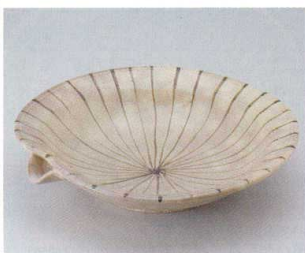
218-501-57 5,000円 黄粉引片口盛鉢十草(24.5×6.5) 521830357