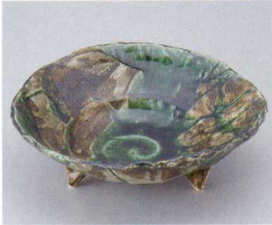
218-101-56 8,000円 織部三つ足菓子鉢(25×24×8) 521810156