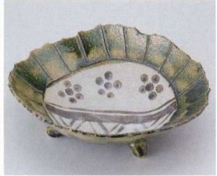
218-104-35 8,000円 手造り織部大鉢(24.5×21×7.5) 521820135