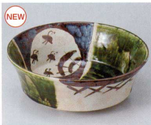
218-401-15 5,800円 織部格子紋反型盛鉢(22.6×8) 621840115