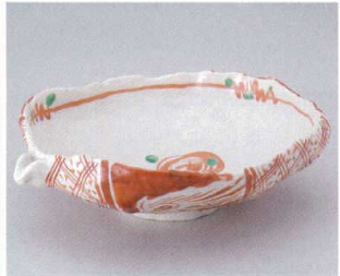
218-204-5 5,900円 赤絵片口鉢(26×21.7×8) 521820305