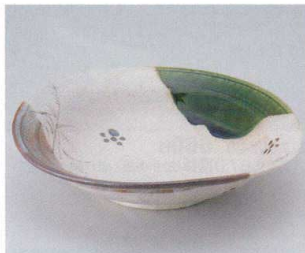
218-403-57 5,400円 織部8.0盛鉢(24×6.5) 521840357