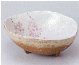
220-504-47 3,000円 しろやま桜三ツ足ボール(21.5×19.3×8.5) 622050447