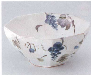
220-302-78 3,750円 粉引ぶどう八角大鉢(18×8.2) 522010378