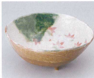
220-503-52 2,850円 織部春秋三ツ足大鉢(21×19×8) 522120252