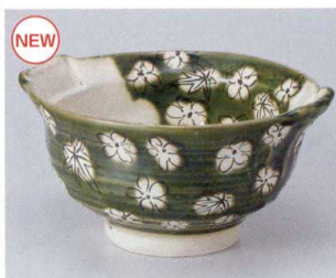
220-201-30 3,580円 織部春秋鍋型6.0鉢(18×16.3×9) 622020130