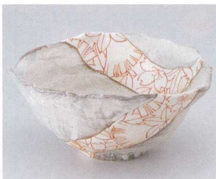
220-203-35 3,500円 京春秋片口井(19.6×17.6×8.5) 522030135