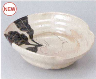
220-103-57 4,000円 黄粉引カブラ瓜型盛鉢(21×19×7.3) 622010357