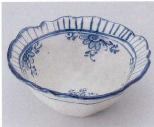
220-101-35 4,380円 手造り安南輪花深鉢(19.5×18.5×8.5) 521920435