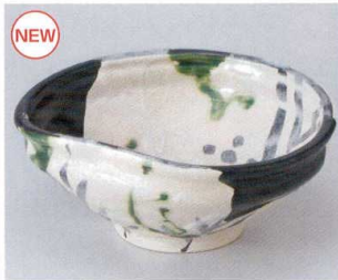
220-303-17 3,900円 黒織部流三ツ押盛鉢(20.3×19.6×8.5) 622030317