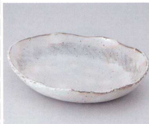
220-501-46 3,900円 粉引クシ目中鉢(20.7×18×5.8) 522610546