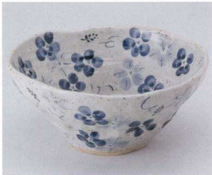
220-304-74 3,600円 亜福窯 藍花ホルム(藍)(18×8.5) 522010474