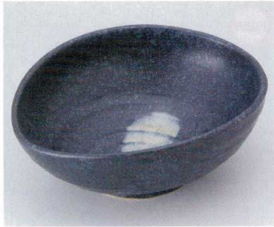
220-404-62 2,550円 銀彩黒たまご8.0鉢(24×20.5×9) 522140262