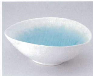
220-502-79 2,400円 白流水フリーボール(23.4×20.1×8.6) 522140377