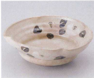
220-102-57 4,500円 黄粉引椿文木瓜鉢(19×20.5×6.8) 521910157