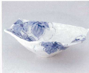
220-401-35 3,300円 ぶどう絵瀬戸具須舟型盛鉢(24.5×15.3×7.6) 522040335