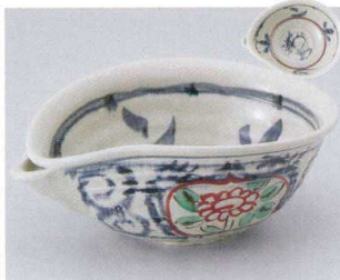
220-202-30 3,500円 赤絵安南片口6.5鉢(20×14.8×7.8) 522030330