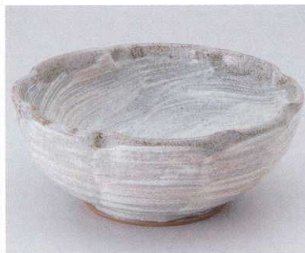
220-301-57 3,000円 御本手粉引菓子鉢(19×7.8) 522050457