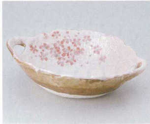
220-403-52 2,950円 平安桜両手付鉢(26×17.5×7.5) 522110352