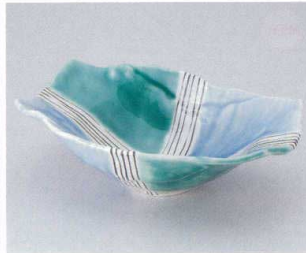
220-402-35 2,980円 二色交趾舟盛鉢(24.5×15.5×8) 522110135