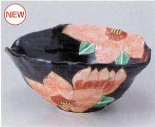
220-104-75 3,500円 黒織部芙蓉 片口鉢(19.5×17.5×9) 622010475