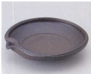
221-401-34 3,550円 炭化土片口7.5鉢(24×22.5×5.5) 522020334