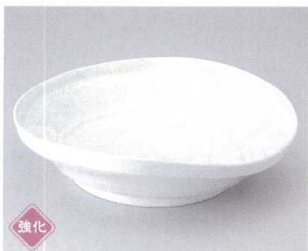
221-501-34 2,900円 白磁たわみ8.0鉢(23×22×5.5) 522120334