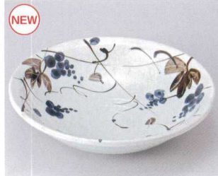
221-101-78 4,800円 粉引ぶどう7.5平鉢(23.5×6) 622110178