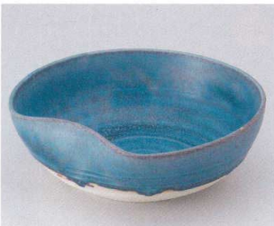
221-303-24 3,400円 京青大鉢(21×7.5) 522040224