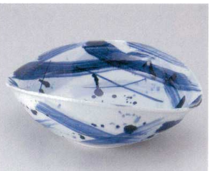
221-402-34 3,450円 呉須格子たわみ8.5鉢(25.4×20×8.8) 522040134