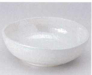
221-502-70 3,100円 真珠7.0丸鉢(22.8×20.8×7.5) 522420371