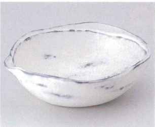
221-302-16 2,700円 化粧流片口7.0鉢(20.3×18×6.5) 522130216