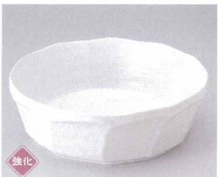
221-404-34 3,300円 NB面取り23cm鉢(23×7.2) 522040434