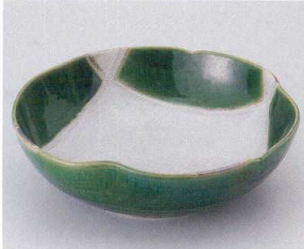
221-103-74 4,420円 織部格子三ツ押盛鉢(19.5×19.2×6.5) 521920377