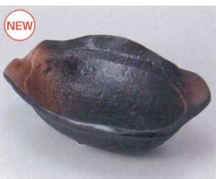
221-503-28 3,870円 いさり火 大鉢(29×20.3×8.5) 622150328