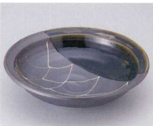
221-403-70 3,750円 掛アミ南蛮円付8.0丸鉢(24.9×6) 522010171