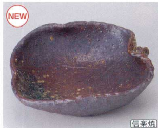
221-301-92 4,000円 茶窯変葉型鉢(25×22×7) 622130192