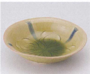
221-202-78 3,950円 灰釉かき落し7.0鉢(22×5) 521950478