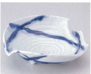
221-504-34 3,550円 呉須流し変型8.0鉢(24.5×7.5) 522020134