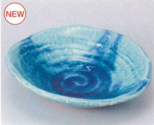
221-102-35 3,650円 トルコニ彩なぶり7.0鉢(23.2×22.2×6) 622110235