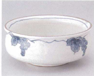
221-104-78 4,000円 御本手ぶどうあづけ鉢(16.5×6.8) 521930378