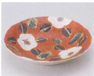
221-204-70 3,540円 赤濃山茶花7.0鉢(22.3×4.3) 522020271