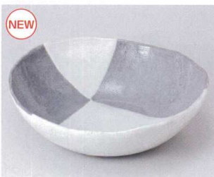
221-203-78 3,500円 黒化粧塗分け7.0ボール(21.2×20.5×6.2) 622120378