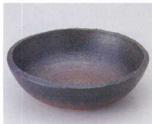
221-201-51 4,000円 備前風クシメ7.0鉢(21.7×6.5) 522420151