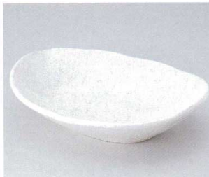
224-202-52 1,850円 斑点粉引楕円盛鉢(24×18.5×6) 522240452