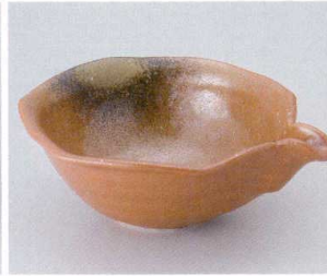
224-303-35 1,450円 柿伊賀片口6.0鉢(21×18×8) 522320235