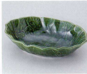
224-302-57 1,500円 織部手折り盛鉢(26×17×5.7) 522330157