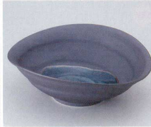
224-103-1 1,850円 錆黒たわみ大鉢(22×18.5×7.4) 522240301