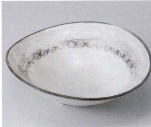
224-102-5 2,500円 粉引印花紋楕円鉢(21×19.5×6.3) 521050105