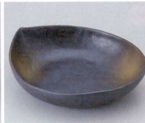
224-403-60 1,100円 うでいりーフ丸大鉢(21×18×5) 522650260