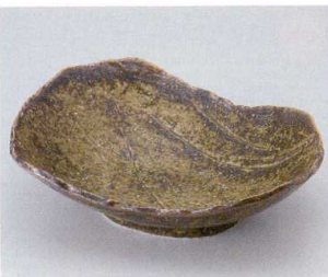
224-201-28 1,700円 不動大鉢(22.5×17.5×6) 522250328