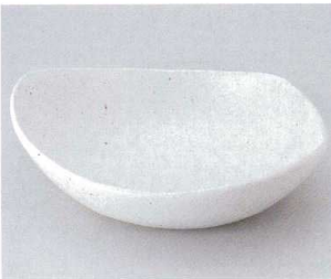
224-301-35 1,550円 白釉変型盛鉢(23×20×5.2) 522320135