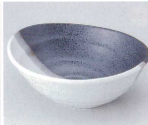
224-203-70 1,880円 塗分小判型ボール(18.5×15.4×6.7) 522250171