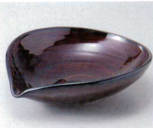
224-101-25 2,480円 漆ブラウン片口ボウル大(21.5×19.0×6.0) 548550125