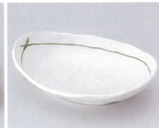
224-504-58 620円 一珍織部楕円あずけ鉢(21×15.8×4.5) 522740358