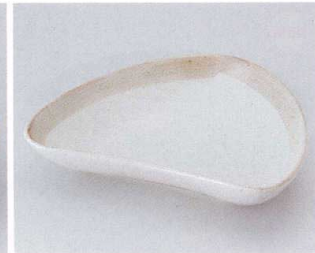
224-404-56 760円 梨地半月鉢(20.5×17.3×4.5) 522730356