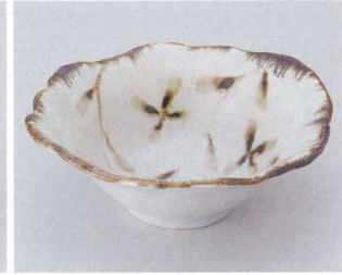
224-304-62 1,350円 サビ花たたら中鉢(19×17.5×7) 522340362