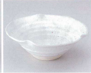
224-104-33 1,950円 白唐津あさがお6.5鉢(20×7.3) 522230133