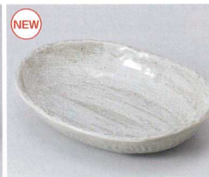
224-503-28 840円 粉引ハケメ バスケット(大)(22.5×17.3×4.8) 62450328