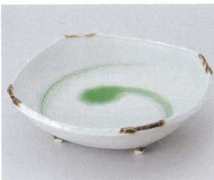
224-401-11 1,350円 龍の舞中鉢(19×19×6) 522340211