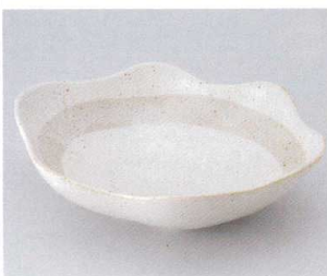
224-501-47 680円 砂うのふ雲型鉢(小)(19.2×15.3×5) 522740247