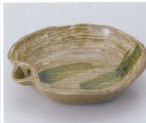
224-402-51 1,150円 黄瀬戸片口穴あき大鉢(19.5×19.3×4) 522350451