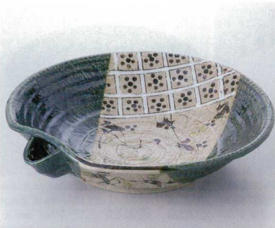
228-101-30 18,000円 織部格子梅片口12.0盛鉢(37×35.6×9.4) 522810130 228-102-30 8,400円 織部格子梅片口9.0盛鉢(26.5×25.2×6.6) 522810230