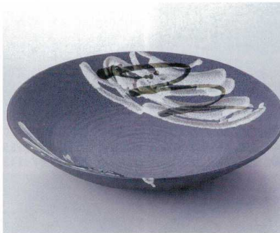
228-202-51 14,300円 鉄黒乱線紋尺2大鉢(36.3×8.6) 522810351