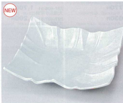
NEW 228-402-51 8,800円 青白磁折紙正角32cm大盛皿(32.3×32.3×9) 622840251