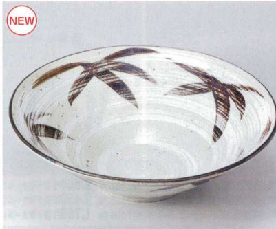
NEW 228-103-25 6,200円 雪笹尺反井(30×9.2) 622810325