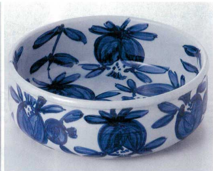
228-203-20 12,000円 手描きざくろ盛鉢(27.8×9.8) 522820320