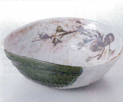
228-201-30 13,700円 織部古木大鉢(31.5×28×11) 522820130