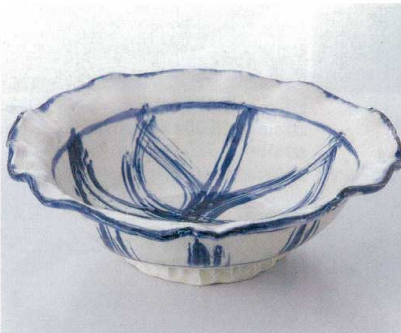
228-301-30 10,500円 手造り安南10.0盛鉢(30.5×12) 522830130