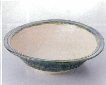
228-303-34 8,800円 外織部クシメたわみ大鉢(37×35×10) 522840134