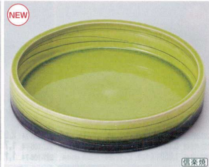
NEW 228-104-92 9,000円 萌黄切立鉢(31.5×6.5) 622810492