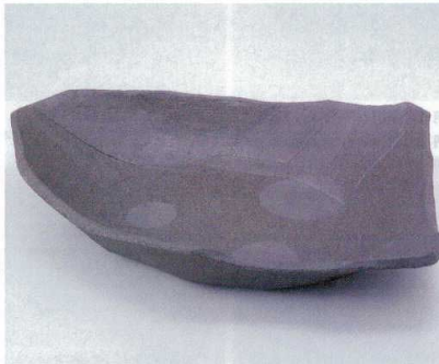
228-302-34 9,500円 炭化土変型13.0盛鉢(41×28×7.6) 522830234