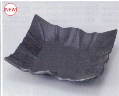
NEW 228-403-51 9,600円 炭化土折紙正角32cm大盛皿(32.3×32.3×9) 622840351