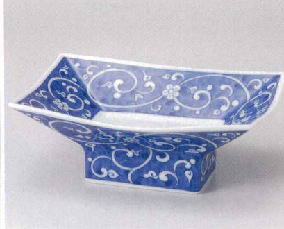
23-103-34 3,420円 染付濃唐草高台向付(20×14.5×7.5) 502830234