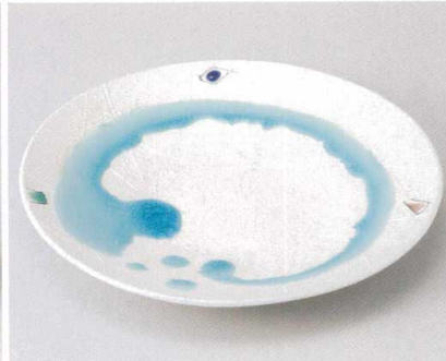
23-202-5 3,200円 青海逸品皿(22.3×3) 502940105