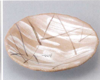
23-303-5 3,100円 手造り乾山浅中鉢(18.5×3.5) 503110205