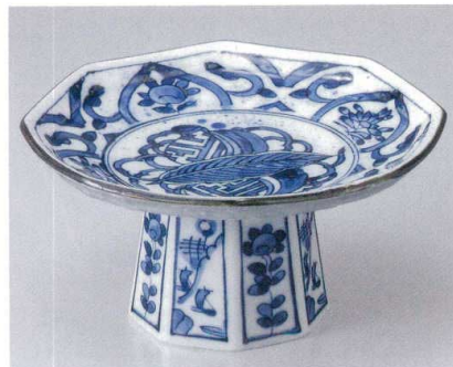
23-301-5 3,200円 染付ふよう高台皿(16.5×8.5) 503040205