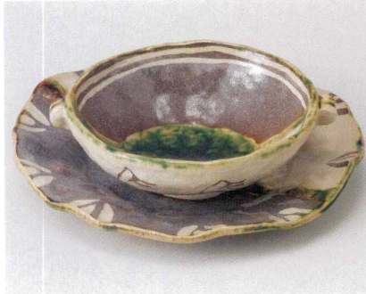
23-101-5 2,400円 志野織部碗(13.5×5.3-350cc) 502910105 23-102-5 2,100円 志野織部皿(20.5×2.8) 502910205