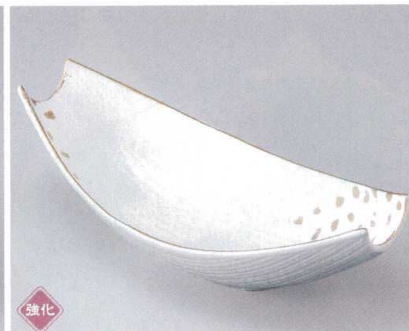
23-402-78 3,100円 金吹雪向付(22.8×10×7) 503040378