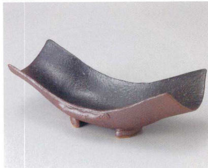
23-201-51 3,300円 備前長角向付(24.4×10.6×9.1) 502820151