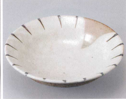
23-104-35 3,300円 かいらぎ十草6.5浅鉢(20.5×5.6) 503030235