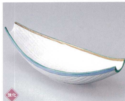
23-401-34 3,100円 (強化)パール舟形向付(25.5×9.8×7.3) 503110134