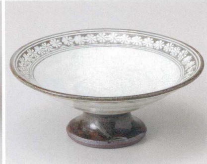
23-203-34 3,200円 (手造り)粉引印花5.0高台鉢(15.8×6.5) 502920134