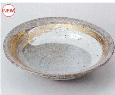
232-402-2 23,000円 唐津金刷毛目大鉢(31.5×9) 623240202