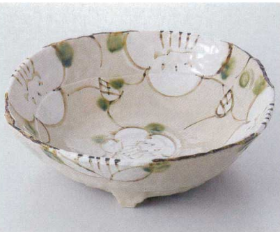
232-201-30 4,400円 格子花盛鉢(26×24.5×7.5) 523220130