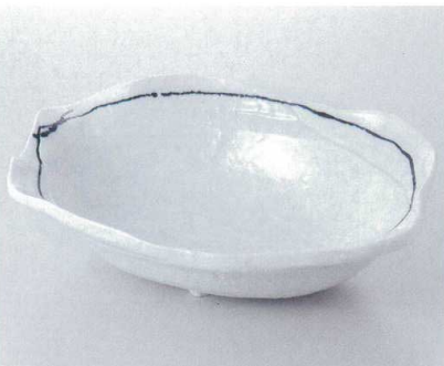
232-301-51 4,000円 黒結び石目大盛鉢(29×20×6) 523230251