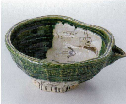
232-102-61 4,400円 織部片口深大鉢(27×22×10.5) 523210361