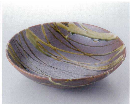
232-203-35 5,800円 明世茶十草尺井(30×8.2) 522940335