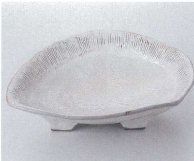
232-202-31 4,280円 御本手クシ目変型10.0盛鉢(31×23.5×8.4) 523220231