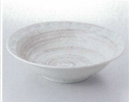
232-103-54 5,200円 東風石目リム10.0鉢(31×8.8) 523040154