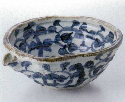
232-101-61 4,400円 タコ唐草片口深大鉢(27×22×10.5) 523210261