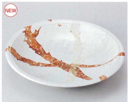
232-303-25 1,890円 白東雲9.5寸盛皿(29×6.1) 623230325