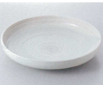
232-401-54 3,950円 東風石目10.0盛鉢(31.5×6) 523240254