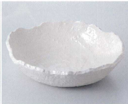
235-302-84 2,000円 白釉盛鉢(27.5×24.5×7) 523530384