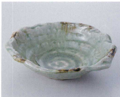
235-401-81 1,700円 砂ビード口たわみ鉢(23×20×6.5) 523530281