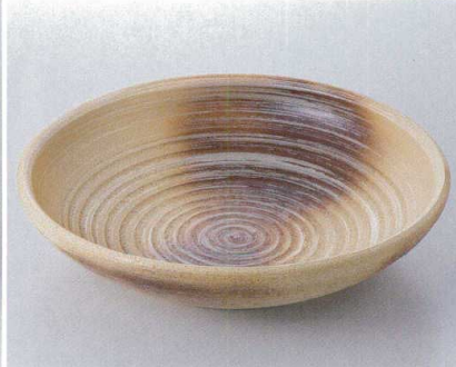
235-103-84 3,500円 伊良保10.0盛鉢(29.5×8) 523510284 235-104-84 1,950円 伊良保8.0盛鉢(24.5×6.7) 523510384