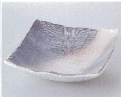
235-403-84 2,700円 志野正角盛鉢(24.5×24.5×8) 523420384