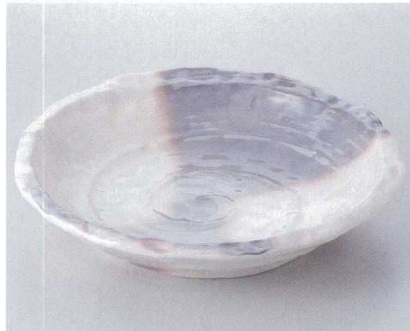
235-201-82 2,900円 志野10.0変形丸深皿(30.7×30.5×6) 523520182 235-202-82 1,700円 志野8.0変形丸深皿(24.5×25×4.7) 523520282