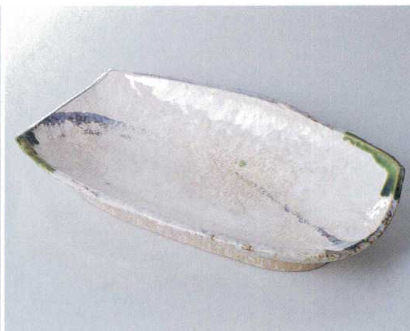
235-402-81 1,900円 織部流10.0長角盛鉢(31×18.5×5) 523440281