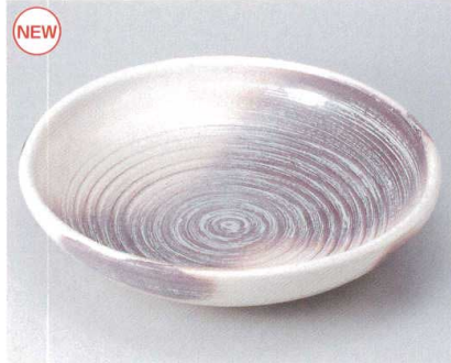
NEW 235-101-82 3,700円 志野10.0盛鉢(29.5×7.5) 623510182 235-102-82 2,000円 志野8.0盛鉢(24×6.5) 623510282