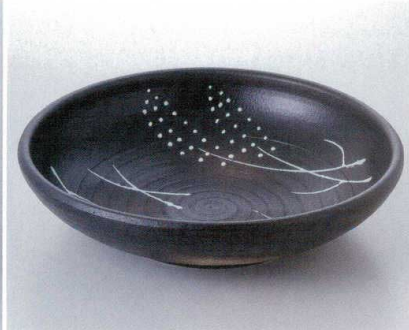
235-105-82 3,700円 むさしの10.0盛鉢(29.5×7.5) 523510482 235-106-82 2,000円 むさしの8.0盛鉢(24×6.5) 523510582