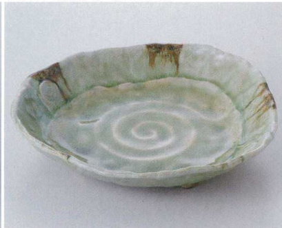
235-204-81 2,400円 砂ビード口9.0盛皿(27×26×6) 523520481