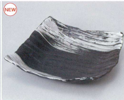
NEW 235-303-84 2,600円 白刷毛目正角盛鉢(28.5×27×6.5) 623530384