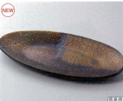
NEW 236-401-92 8,000円 金彩楕円皿(48.5×25×4) 623640192