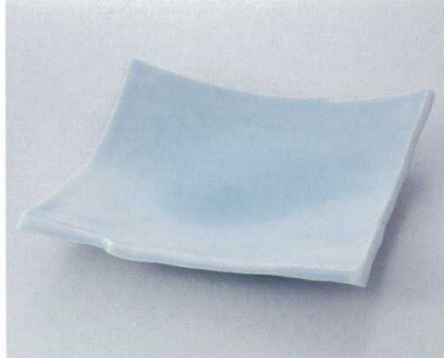
236-102-34 7,500円 青白磁井桁10.0正角盛皿(30×30×5.7) 523720234