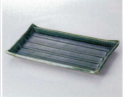
236-103-70 13,800円 織部手おこし長角大皿(39.8×24×4.7) 523610371