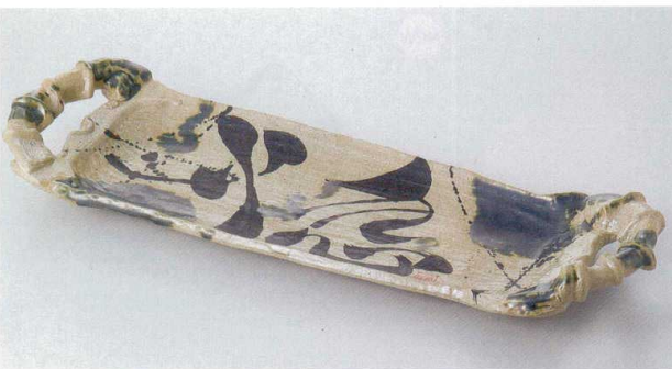
236-301-5 5,000円 両手付はれる盛皿(49×17×6) 523630205