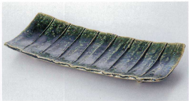
236-302-34 11,850円 (手造り)織部ソギまな板皿(36×15.6×4.6) 523630334