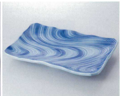
236-204-34 12,800円 青磁流水彫14.0盛込皿(41.5×28×5) 523620434