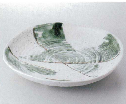
236-201-15 13,200円 岩肌刷毛13.0皿(41×3) 523620115 236-202-15 4,000円 岩肌刷毛10.0皿(30.5×6) 523620215