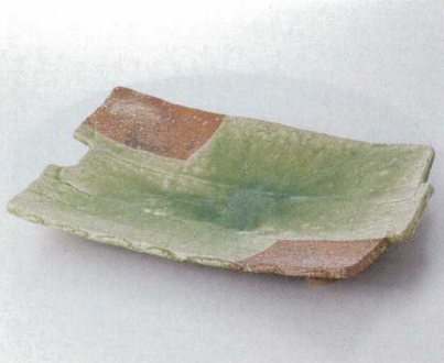
236-101-34 20,500円 (手造り)伊賀灰釉変型盛込皿(38×25×5.5) 523610134