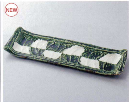
NEW 236-403-35 5,850円 織部市松大長皿(48×17×4) 623640335