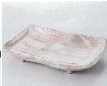
236-402-34 8,400円 御本手まな板盛込皿(36×23.5×5.5) 523640234