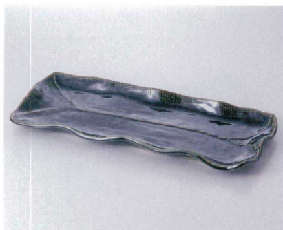
237-201-70 7,950円 織部15.0長角皿(44×17.7×3.5) 523720171