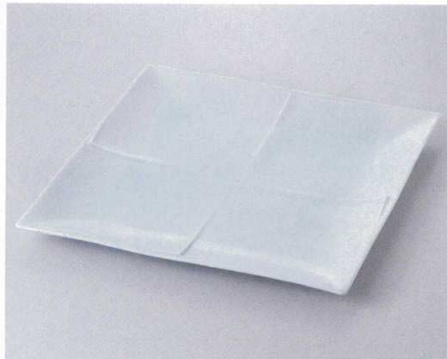
237-103-74 5,800円 うすあさぎ大皿(29.5×29.5×2) 523820174