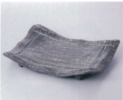
237-402-35 6,900円 炭化土白化粧12.0盛込皿(37×26.2×5) 523740235