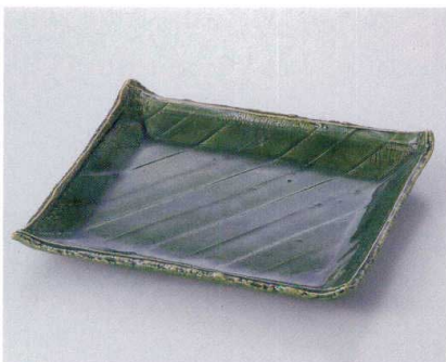
237-302-70 7,740円 織部手おこし長角皿(26.7×22.5×3.7) 523730271