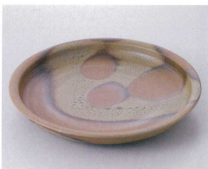
237-203-51 7,400円 備前10.0皿(31.8×4.7) 523720351