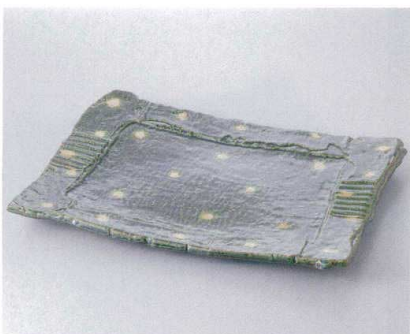
237-303-34 7,250円 織部黄瀬戸小紋13.0盛皿(39×28×3.5) 523730134