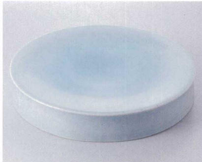
237-102-34 7,700円 青白磁水面11.0高台皿(32×5.5) 523710334