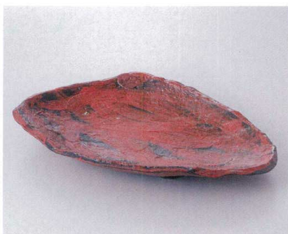
237-202-34 5,000円 根来釉変形12.0皿(36.5×23×5) 523940334