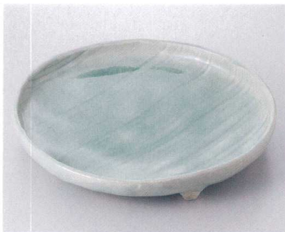
237-301-30 14,400円 灰青磁流水丸大皿(32×4) 523610230