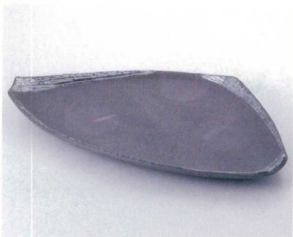
237-401-35 6,000円 炭化土プラチナ三角13.0皿(41×24×4.5) 523830235