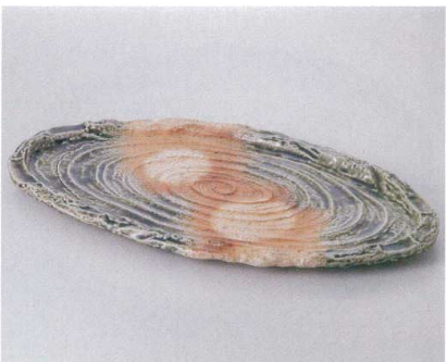
237-403-51 7,400円 嵯峨野パーティー皿(48×25.5×3) 524410151