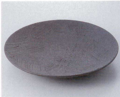
238-201-25 5,600円 黒土刷毛目 9.5寸皿(28.3×4.3) 524410225