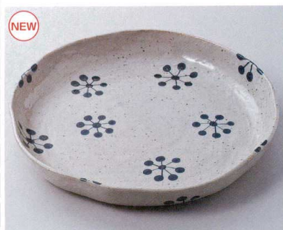
238-401-78 4,650円 藍染9.0丸皿(28×3.5) 623840178