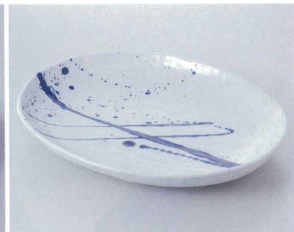
238-403-61 5,000円 呉須吹櫛目楕円大皿(37×29×5) 523840361