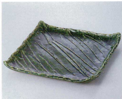
238-301-5 6,200円 織部ソギ正角盛皿(30.8×30.8×3.5) 523830105