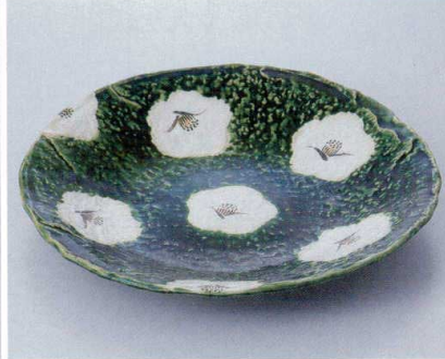
238-102-5 6,400円 織部椿盛皿(32.8×4.5) 523810405