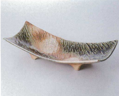
238-101-61 6,750円 嵯峨野長角大盛皿(40.6×16×9) 523910161