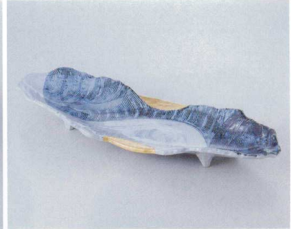
238-203-35 6,200円 金彩呉須櫛目長皿(42.8×14.5×5.5) 523820335