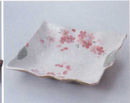
238-304-56 5,000円 春うらら波大皿(26.5×5.7) 523830356