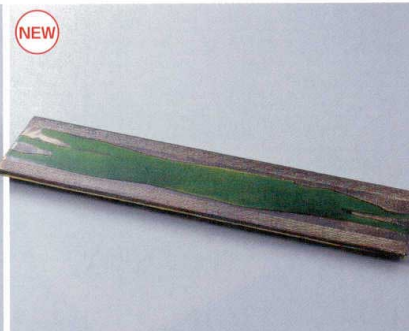
238-302-34 5,200円 銀袖ヒワ流し17.0長皿(53×12.5×2.5) 623830234 238-303-34 4,070円 錆袖ヒワ流し15.0長皿(47×12.5×2.5) 623830334