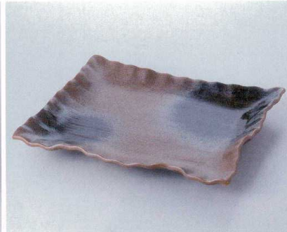
238-202-62 6,800円 美濃備前波型大角皿(35.5×29×5) 523820262