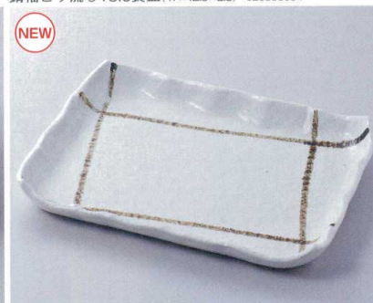
238-402-70 7,200円 粉引らせん長角大皿(37×27.5×4.5) 623840270