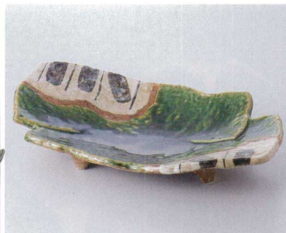
239-402-5 5,700円 織部十草盛皿(37.5×23×7) 523940205