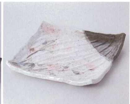
239-203-30 6,000円 織部古木長角大皿(31×27×4) 523920330