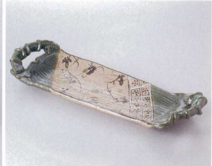
239-103-30 6,000円 織部格子梅両手長皿(41×17.3×7) 523910330