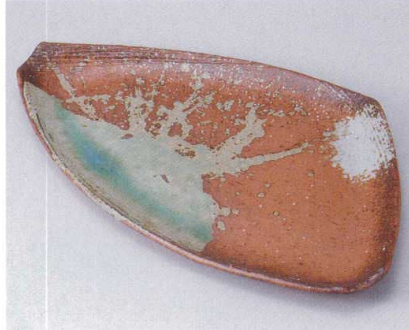
239-101-30 5,750円 信楽風三角盛皿(41.5×24×3.8) 524030230