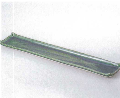
239-401-34 6,200円 織部クシ目18.0長角盛込皿(52.8×11×2.8) 523940134