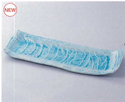
239-301-30 4,250円 マリンプルーガタ彫長角大皿(46.5×16.5×4) 623930130