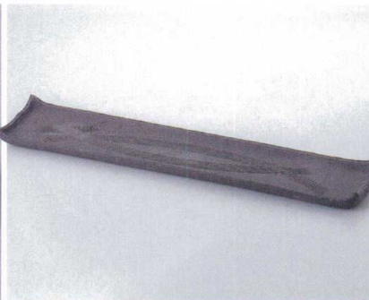
239-302-5 7,100円 炭化土ボタモチ18.0長皿(52×10.5×3) 523930205