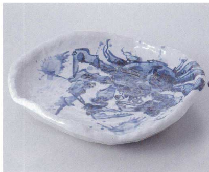
239-201-5 5,200円 染付カニ絵変型10.0皿(32×30×6.5) 524220105