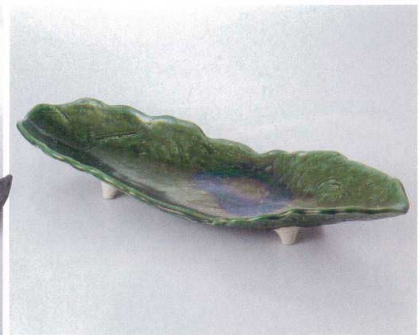
239-303-78 6,520円 織部四ツ足盛込皿(48×16×7) 523930378