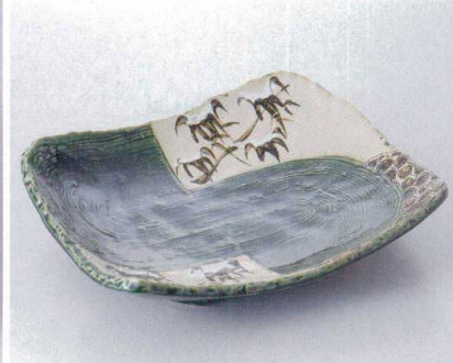
239-102-30 6,580円 織部雪笹四ツ足長角大皿(30×26.5×7) 523910230