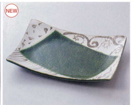
239-403-25 3,700円 織部トチリ大盛皿(33×23.5×5) 623940325