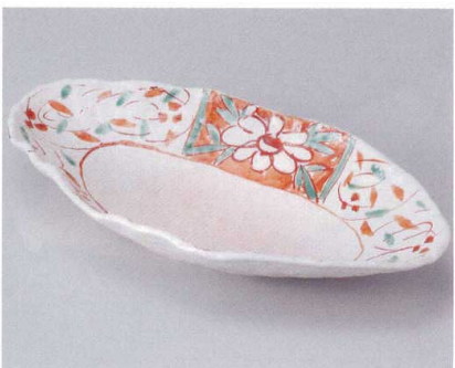
24-403-34 2,750円 志野赤画間取楕円9.0鉢(25.5×14×4) 503210334