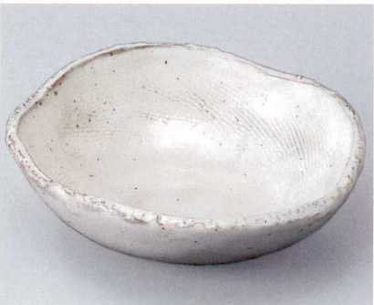
24-301-46 3,000円 粉引クシ目小鉢(15.5×13.6×4.3) 504410246