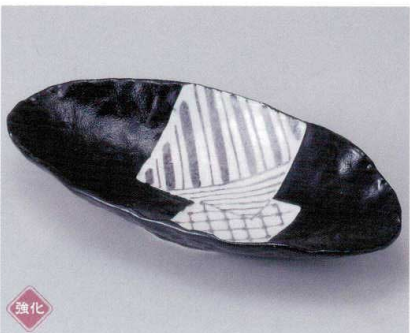
強化 24-402-30 2,750円 黒織部8.3皿(25.3×13.3×4.5) 503310130