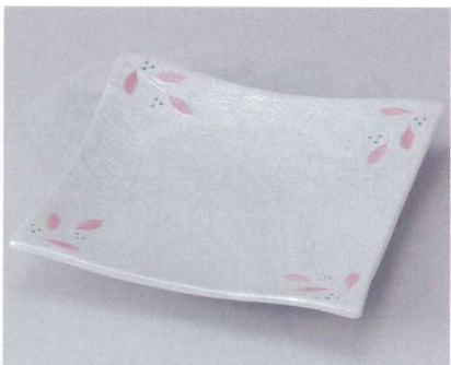
24-303-5 2,750円 花絵ラスター正角皿(18×18×4) 503240305