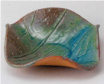
24-101-35 3,000円 深海波型鉢(大) (21×21×6) 502830135