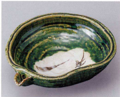
24-203-34 2,850円 織部つぼめ片口向付(20×17×5.5) 503140234