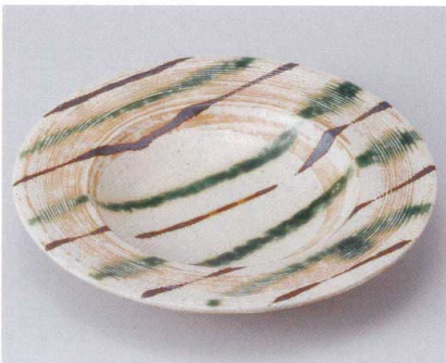
24-302-34 2,800円 織部流し6.5浅鉢(20×3.5) 503210134