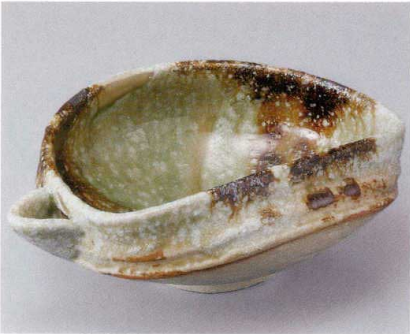
24-201-5 2,950円 灰釉流片口向付(16.7×13×6) 503120305