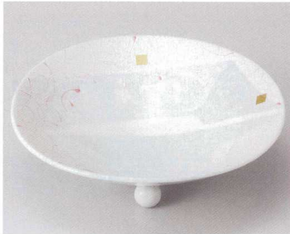
24-102-5 3,000円 乱線ピンク6寸向付(18.8×6) 502940305