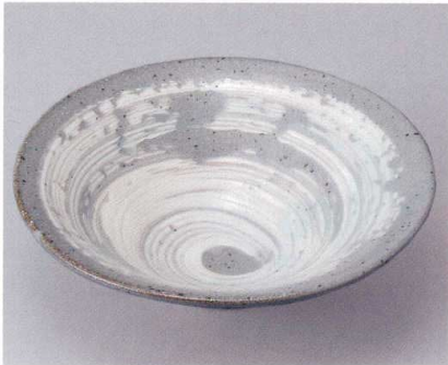
24-202-25 2,900円 粉引刷毛向付(18.5×5.5) 503130425