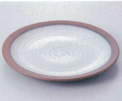
240-202-5 6,800円 粉引白うのふ10.0皿(29.8×3) 523810305