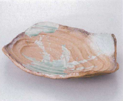
240-103-5 5,700円 信楽風渦彫11.0皿(35×27.2×7) 524010305