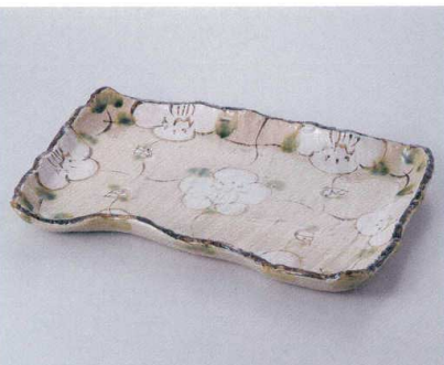
240-302-30 5,500円 格子花変型長角皿(37×24.5×3.5) 524130130