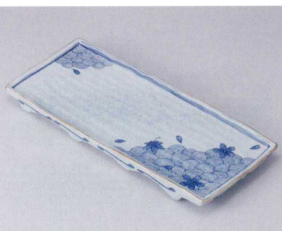
240-402-34 5,200円 染付春秋長角13.0皿(39.8×16.8×3) 524040234