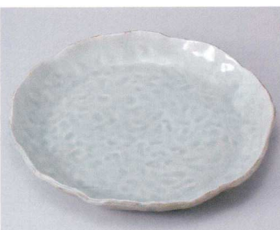
240-401-74 5,200円 白化粧10.0波型盛皿(31×4) 524030174