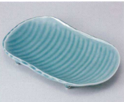
240-303-34 5,380円 深海青磁マナ板皿大(37.5×23×4.3) 524030334