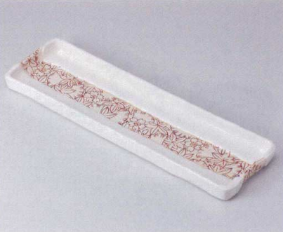
240-102-30 5,800円 春秋長大皿(45×13.8×3) 524010230