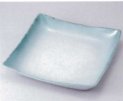
240-201-78 6,300円 織部吹11.0正角大皿(32.5×32.5×6.2) 525230278