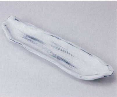
240-203-16 5,000円 化粧流長盛皿(50×14×5) 524020316