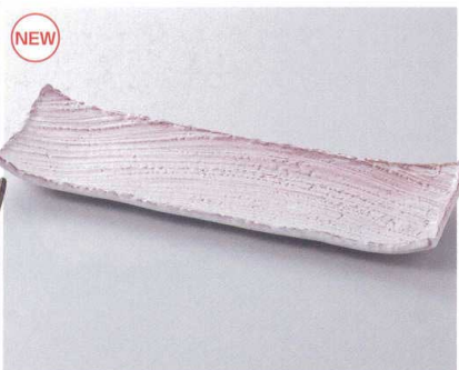
NEW 241-404-47 3,800円 紅粉引枯山水長角皿(大)(41×13×4) 624140447 241-405-47 2,500円 紅粉引枯山水長角皿(中)(31×12.5×3) 624140547