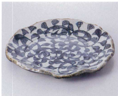
241-201-30 5,500円 たご唐草大皿(33.5×31×4.5) 524120130