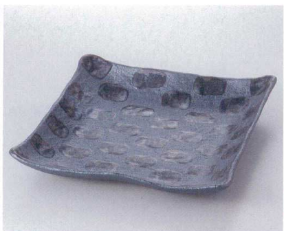
241-303-46 4,400円 黒市松角特大皿(27.8×27.8×4.5) 524130346