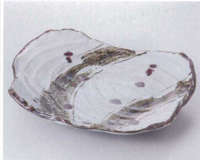
241-103-30 5,750円 錆絵辰砂渦彫11.0盛込皿(35×27×7) 524110330