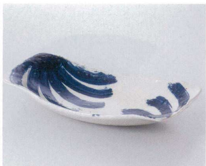
241-203-30 5,000円 手造り安南長角盛皿(35×16.5×6) 524120330