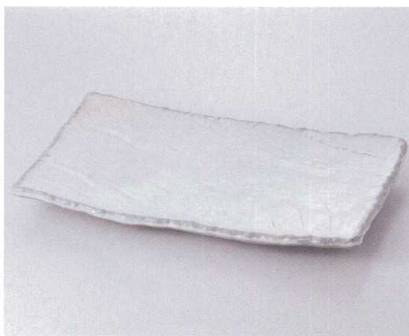
241-302-30 4,380円 御本手クシメ12.0長角皿(37.5×21.5×4.5) 524420230