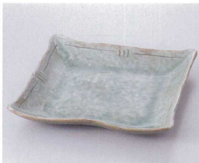
241-202-78 5,500円 緑彩貫入10.0角皿(28.5×28.5×4.5) 524120278