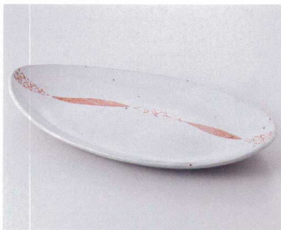
241-301-56 4,200円 赤絵流紋楕円盛鉢(36×20.5×6) 524240156