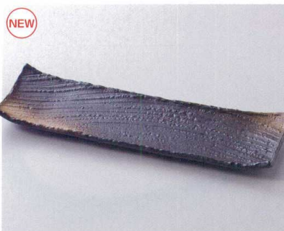
NEW 241-402-47 3,800円 備前吹枯山水長角皿(大)(41×13×4) 624140247 241-403-47 2,500円 備前吹枯山水長角皿(中)(31×12.5×3) 624140347