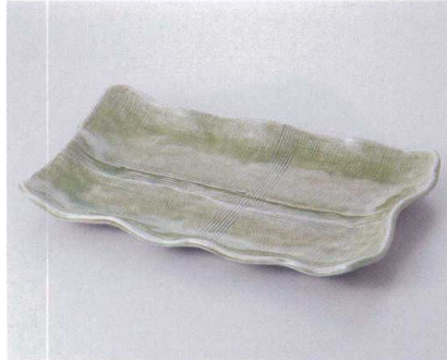
241-101-78 7,950円 灰釉12.0長角皿(38×22.5×4.3) 524110178