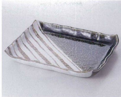
241-102-78 7,300円 織部ストライプ長角大皿(37×27.5×4.5) 524110277