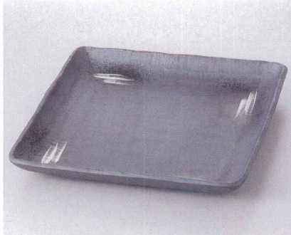
243-102-51 4,500円 金彩角大盛皿(27.8×3) 524310251