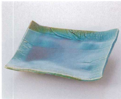
243-201-16 5,900円 深海四ッ足寿司皿(23.5×21.2×5) 524320116