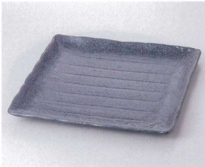
243-303-63 3,880円 嵐山10.0四方皿(黒)(31.5×31.5×2.7) 524340363