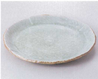
243-402-73 3,350円 唐津おふけ9.0丸皿(28.4×2.5) 524340273