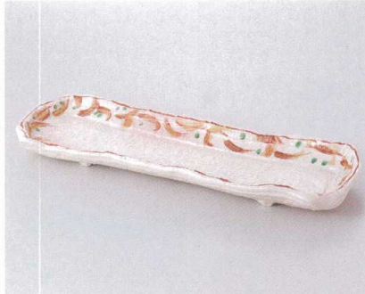
243-101-34 4,800円 志野朱金刷毛目長角盛皿(37×12×3.5) 524310134