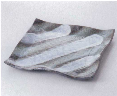
243-203-16 4,900円 飛鳥 四角皿(26×26×3) 524320316