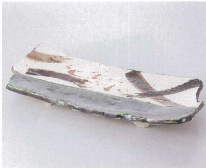
243-302-34 4,500円 織部線段12.0長皿(38×15.6×4.2) 524330234