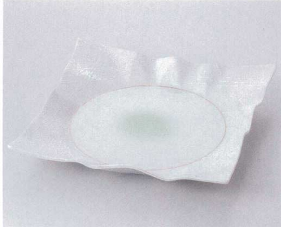
243-103-30 4,650円 一珍ラスターヒワ吹9.0折紙皿(27×27×4.2) 524310330