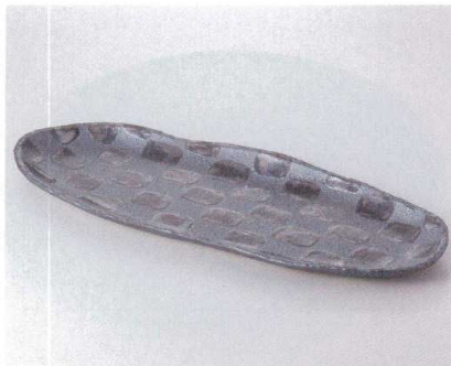
243-401-46 4,200円 黒市松パーティ盛皿(44.5×15.5×2.7) 524340146