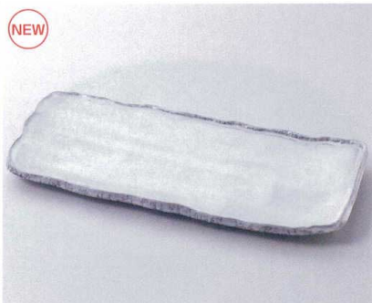
243-403-82 2,400円 白釉長方皿(38.5×17×3) 624340382