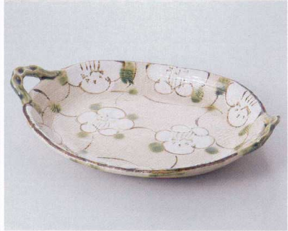
244-103-30 4,480円 格子花楕円両手11.0皿(36×25×6.3) 524430230