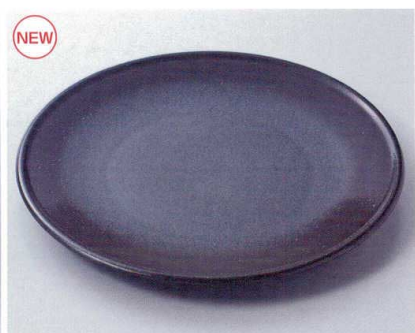
244-403-51 6,800円 宴(黒)35cm大皿(35.7×3.7) 624440351