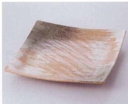
244-302-63 3,750円 信濃路正角盛皿(28.5×28.5×3.5) 524440263