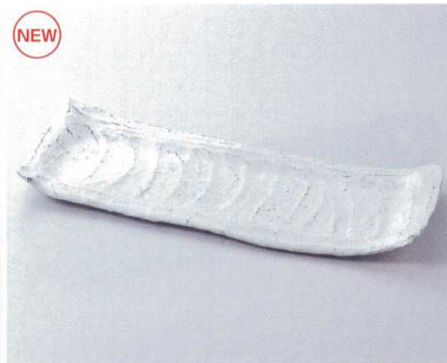
244-202-61 5,900円 粉引波彫46cm長皿(46×15.5×3.8) 624420261