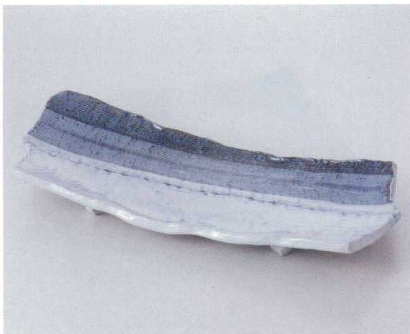
244-201-34 4,300円 呉須線段12.0皿(37×15.5×4) 524430134