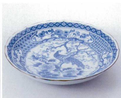
244-402-62 6,100円 孔雀12.0大皿(36.5×6.5) 523840262