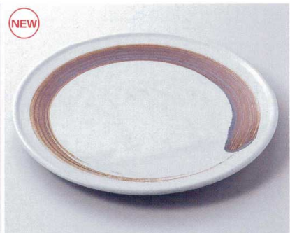
244-303-51 6,800円 宴(白)35cm大皿(35.7×3.7) 624430351