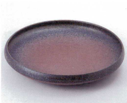
244-301-34 3,550円 BIZEN8.0鉢(24.5×4.3) 524440334