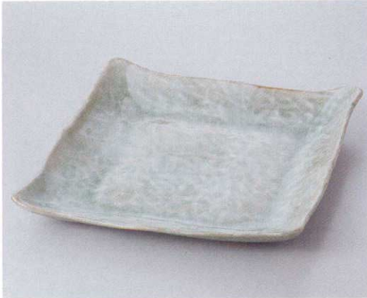
244-101-74 4,800円 白化粧10.0正角盛皿(29×29×4) 524420174