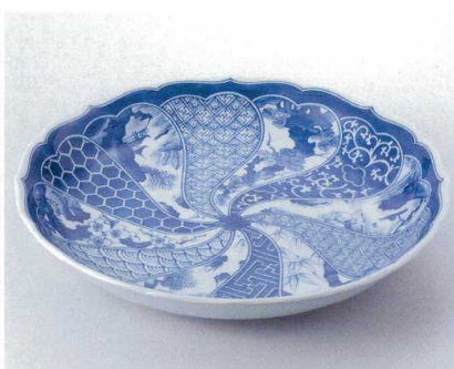
244-401-62 6,100円 祥瑞山水12.0大皿(36.5×6.5) 523840162