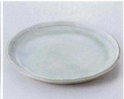
246-303-78 3,650円 緑彩貫入9.0丸皿(27) 524630378