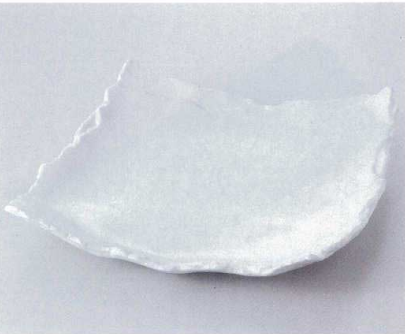
246-201-34 3,620円 白マット重ね8.5皿(25×26×4.3) 524620134