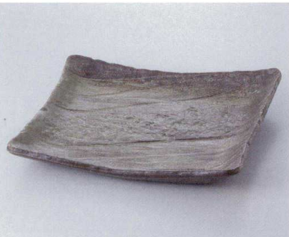
246-301-25 3,300円 越前角大皿(29.7×24.7×4.3) 524640325