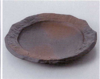
246-103-34 3,780円 備前風リム付8.5皿(26×3) 524610334