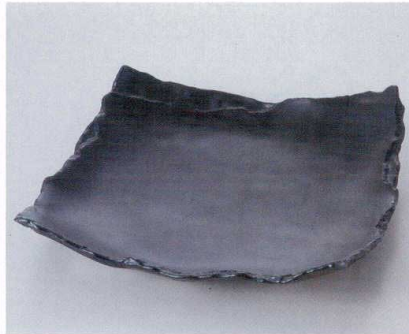
246-202-34 3,620円 黒マット重ね8.5皿(25×26×4.3) 524620234