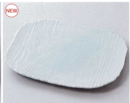
246-402-52 5,800円 織部 10.0皿(33.5×4.5) 624640252 246-403-52 2,700円 織部 8.0皿(25.5×3.7) 624640352