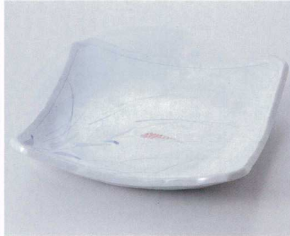
246-102-5 3,800円 手影芦10.0盛皿(24×24×5) 524610205