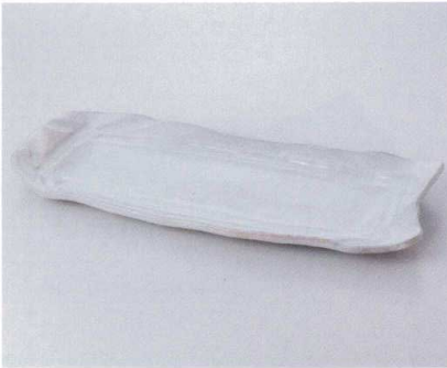
248-201-34 3,150円 御本手12.0長角盛皿(38.5×15.5×3) 524820134