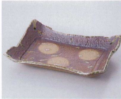
248-202-30 3,550円 ポタモチ砂目変型長角8.5皿(26.5×19.5×5.3) 524820230