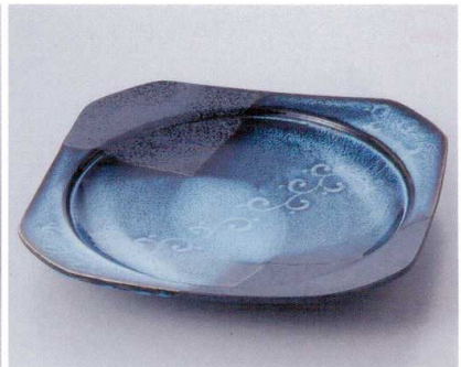
248-303-16 2,900円 清流つた大角皿(27.5×27.5×4.3) 524830316