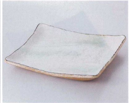
248-203-25 3,200円 安曇野角大皿(30.5×24.5×5.0) 524820325