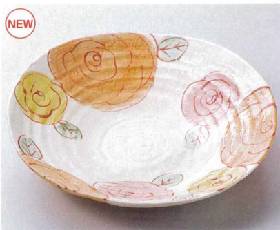
NEW 248-401-30 3,750円 色彩バラ8.0盛鉢(25×5.4) 624840130