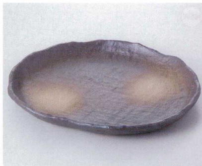
248-402-57 2,600円 黒備前盛皿(31×26×3) 524840257