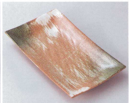
248-403-63 2,500円 信濃路11.0長盛皿(33.5×19.5×3.5) 524840363