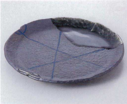
248-101-70 3,400円 南蛮乱十草9.0丸皿(28.8×2.5) 524810171