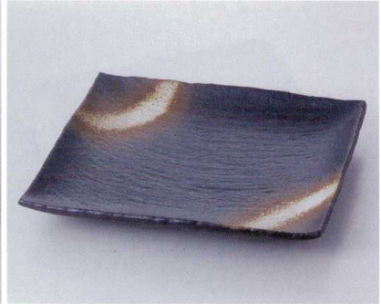
248-103-79 3,000円 黒備前長角大皿(30×26.7) 524810377