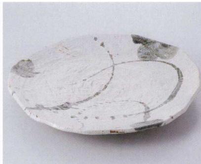
248-302-31 2,800円 織部散し変型9.0皿(30×3.7) 524830231