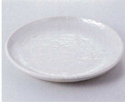
248-102-74 3,100円 真珠9.0丸皿(27.2×3) 524810277