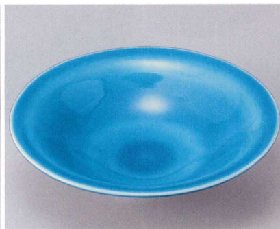
25-202-5 2,850円 交跡トルコ向付(17.2×4.2) 503140305