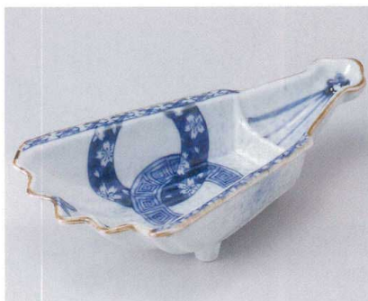
25-201-34 2,700円 染付丸紋扇面向付(22.2×12×5.5) 503230134