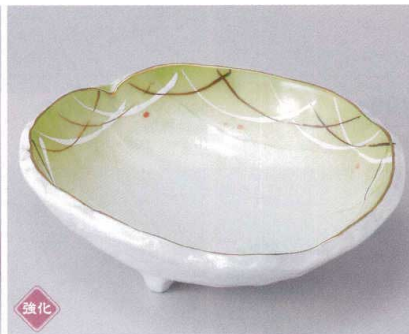
25-302-78 2,650円 グリーン吹カゴメ向付(16×13.8×4.5) 503230377