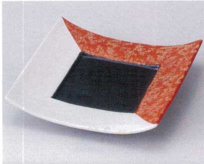
25-101-35 2,750円 半掛金彩正角皿(16.5×16.5×3.7) 503210235