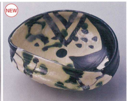
25-203-17 2,600円 黒織部片押し向付(14.7×14×6.5) 602520317