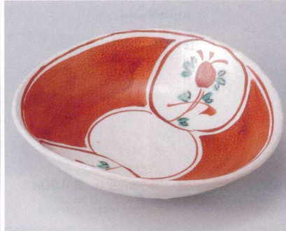
25-102-46 2,700円 朱巻立花楕円向付(17×16×4.7) 503230246