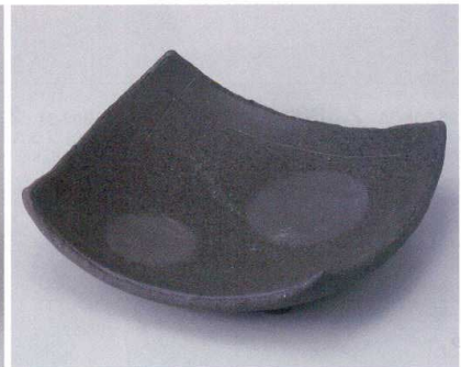
25-303-5 2,500円 炭化土ボタモチ長角向付(17×15×4.5) 503320305