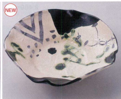
25-402-17 2,500円 黒織部四方鉢(17×5.8) 602540217