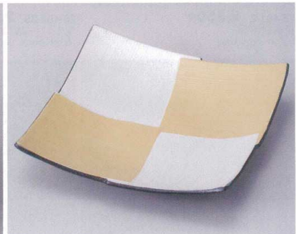
25-403-34 2,500円 二色市松正角向付(18.5×4.5) 503320134