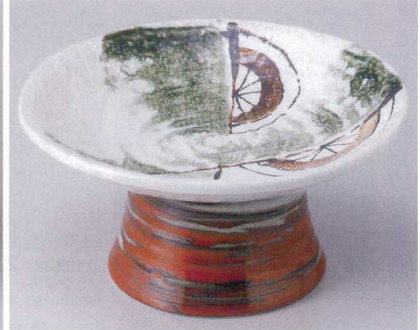
25-103-56 2,700円 花車赤浜特台6寸(19×9.5) 503220356