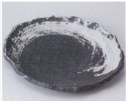
250-303-84 2,100円 白刷毛目盛皿(30.5×26.5×3) 525040384