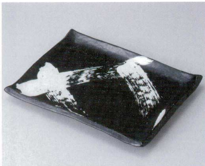
250-201-1 2,700円 黒地白刷毛長角皿(大)(23×30×3.5) 525020101