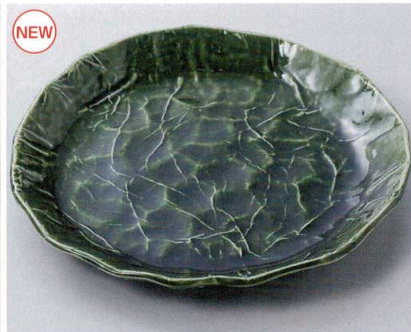
250-202-57 1,500円 織部手折丸大皿(25×24.5×3) 625020257