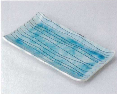
250-101-35 2,680円 湖水長角皿(33×18×3) 525020235