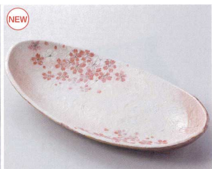
250-403-47 3,000円 平安桜(赤)楕円長皿(31.8×15.8×5) 625040347