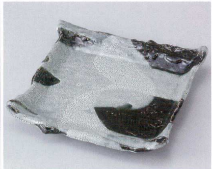
250-203-30 2,900円 カイラギ正角変型皿(22×22×4.3) 525020330