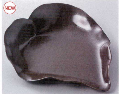
250-103-2 5,500円 鉄釉木ノ葉盛皿(27×23×6.8) 625010302