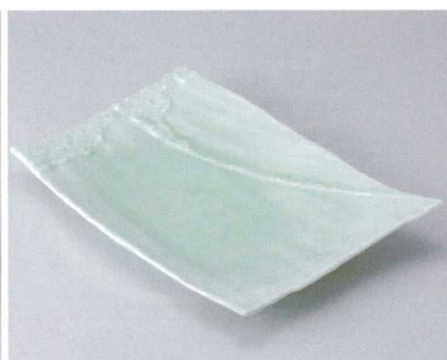
250-402-16 2,350円 ヒワしぶき盛皿(29×19.5×5.7) 525040216