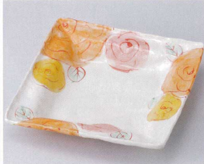
250-102-30 3,300円 色彩バラ正角段付皿(20.5×20.2×4.7) 525010230