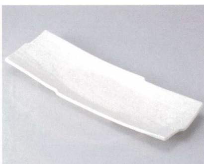
250-401-34 2,500円 定葉木目13.0長皿(40×13.5×3.5) 525040134