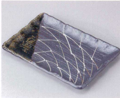
253-203-70 3,650円 掛アミ南蛮10.0長角大皿(30.7×21×3) 525330571 253-204-70 2,480円 掛アミ南蛮9.0長角皿(26×16.3×2.5) 525330671