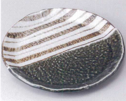
253-501-70 3,370円 織部ストライプ9.0丸皿(28.5×24) 525410577 253-502-70 1,660円 織部ストライプ7.0丸皿(21.5×2) 525410677 253-503-70 1,030円 織部ストライプ6.0丸皿(18.3×2.3) 525410777