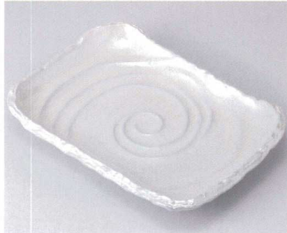
253-201-74 5,650円 真珠足付盛皿(大) (32×23×4.7) 525320174 253-202-74 2,900円 真珠足付盛皿(小) (25×20×4.3) 525320274