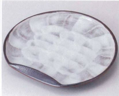
253-105-73 2,950円 備前志野半月10.0皿(27.8×26) 525310573 253-106-73 1,450円 備前志野半月7.0皿(21.5×20) 525310673