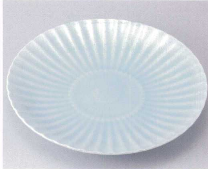
253-103-40 4,750円 青白磁菊10.0皿(30×4.5) 525310340 253-104-40 2,100円 青白磁菊8.0皿(24×3.8) 525310440