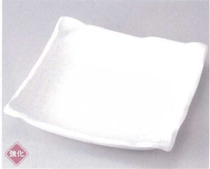
253-305-34 3,780円 NB四方上り26cm皿(大) (26×26×6) 525330334 253-306-34 2,150円 NB四方上り20cm皿(中) (20×20×4.5) 525330434