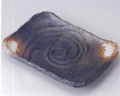
253-401-61 5,100円 黒備前足付盛皿(大) (32.4×23×4.5) 525340461 253-402-61 3,200円 黒備前足付盛皿(小) (25×20.5×3.5) 525340561