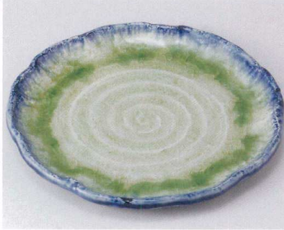
253-303-79 3,700円 灰釉流し9.0丸皿(28×2.4) 525410371 253-304-79 2,650円 灰釉流し8.0丸皿(24.8×2.3) 525410471