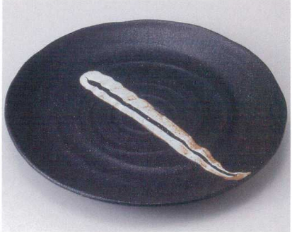
253-601-56 2,100円 漁火9.0丸皿(28×3.1) 525440456 253-602-56 1,300円 漁火7.5丸皿(23.6×3) 525440556 253-603-56 900円 漁火6.5丸皿(19.5×2.6) 525440656