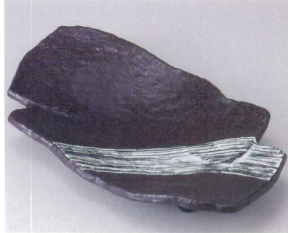
253-101-61 6,000円 銀河盛鉢(大) (36×21.7×7) 525310161 253-102-61 3,000円 銀河盛鉢(中) (30×14.5×7) 525310261