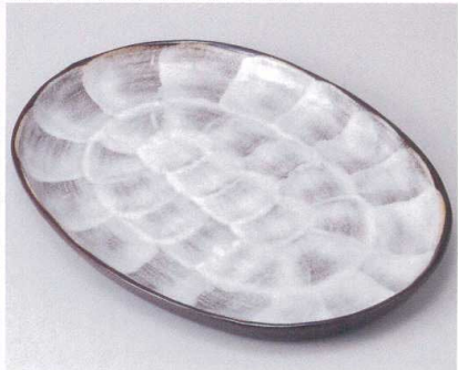
253-205-73 3,150円 備前志野小判11.0皿(34×25×2.5) 525420473 253-206-73 2,950円 備前志野小判10.0皿(31×22.5×2.5) 525420573 253-207-73 1,450円 備前志野小判8.5皿(26×17.7×2.2) 525420673