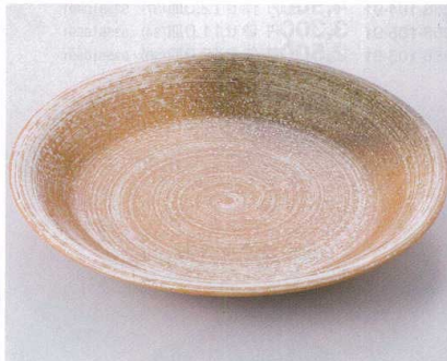
255-203-63 1,350円 信濃路9.0深皿(28×4) 525540763 255-204-63 850円 信濃路8.0深皿(24.5×3.5) 525540863