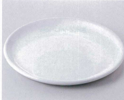
255-104-56 2,200円 桜山志野7.0皿(23.7×2) 525510656 255-105-56 1,400円 桜山志野6.0皿(19.5×1.5) 525510656