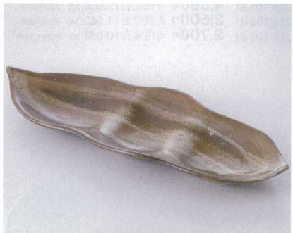
255-205-47 3,800円 錆刷毛目豆型皿(大) (17×43.5×4.7) 525520447 255-206-47 3,000円 錆刷毛目豆型皿(中) (15.5×37.5×3.8) 525520547