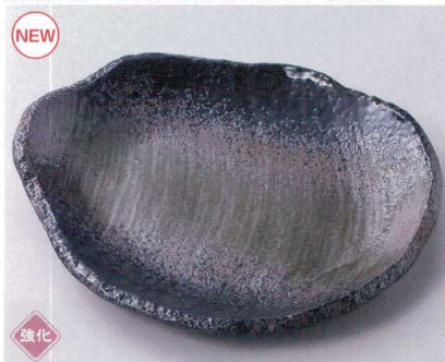
255-301-73 3,850円 黒緑彩変形9.0皿(28×24.5×3.7) 625530173 255-302-73 1,580円 黒緑彩変形7.0皿(20.8×18×2.7) 625530273