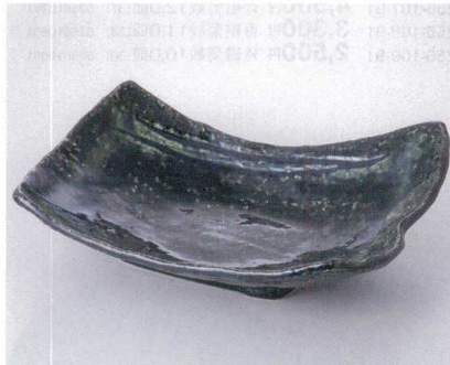
255-201-61 2,450円 黒織部流し 変型尺盛鉢(27.3×18.5×7.5) 525520661 255-202-61 920円 黒織部流し 変型6寸盛鉢(18.3×12.5×5.7) 525520761