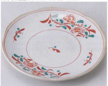
255-305-47 2,200円 花方曆8.0皿(25.5×3) 519840947 255-306-47 1,500円 花方曆7.0皿(21.8×3.3) 519841047