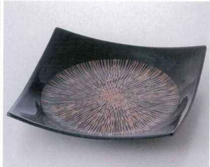
255-106-24 1,500円 刻み乱十草漆黒手引正角7.5皿(23×23×5) 525530724 255-107-24 580円 刻み乱十草漆黒手引正角5.5皿(17.3×17.3×3.5) 525530824 255-108-24 330円 刻み乱十草漆黒手引正角4.5皿(13.5×13.5×3) 525530924