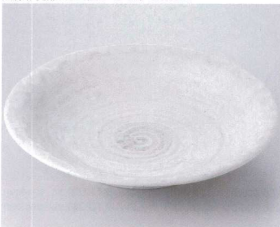
255-401-54 3,400円 東風石目10.0皿(31.5×6) 524730154 255-402-54 2,550円 東風石目9.0皿(27.8×3.6) 524840154