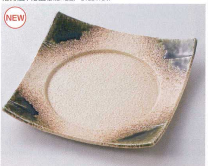
255-405-47 2,390円 伊賀織部7.5四方皿(22.5×22.5×4.5) 625540547 255-406-47 2,010円 伊賀織部6.0四方皿(17.5×17.5×3.8) 625540647