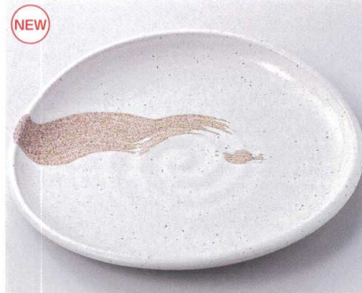
255-101-11 1,800円 砂刷毛目楕円皿(大) (23×22×3) 625510111 255-102-11 1,200円 砂刷毛目楕円皿(中) (19.5×18.5×3) 625510211 255-103-11 650円 砂刷毛目楕円皿(小) (14.5×14×2.5) 625510311