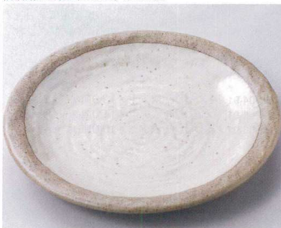
255-303-60 2,650円 白露石目9.0皿(28×3.3) 54421760 255-304-60 880円 白露石目7.0皿(22.7×3.2) 54421660