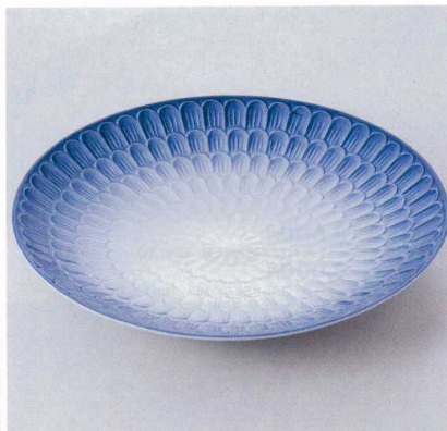
256-201-91 4,500円 吹菊紋12.0皿(37) 525620191 256-202-91 3,300円 吹菊紋11.0皿(34) 525620291 256-203-91 2,500円 吹菊紋10.0皿(30) 525620391