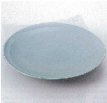
256-101-91 4,800円 青磁高台12.0皿(37) 525610191 256-102-91 3,500円 青磁高台11.0皿(34) 525610291 256-103-91 2,700円 青磁高台10.0皿(30) 525610391