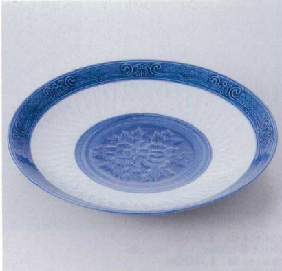
256-104-91 4,500円 倅せ12.0皿(37) 525610491 256-105-91 3,300円 倅せ11.0皿(34) 525610591 256-106-91 2,500円 倅せ10.0皿(30) 525610691