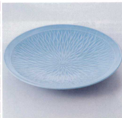
256-301-91 3,500円 ブルー菊彫11.0皿(34) 525630191 256-302-91 2,700円 ブルー菊彫10.0皿(30) 525630291