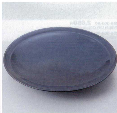
256-303-91 3,500円 天目11.0皿(34) 525630391 256-304-91 2,700円 天目10.0皿(30) 525630491