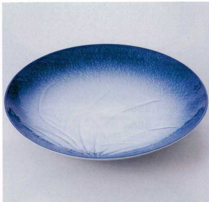
256-204-91 4,500円 吹アヤメ12.0皿(37) 525620491 256-205-91 3,300円 吹アヤメ11.0皿(34) 525620591 256-206-91 2,500円 吹アヤメ10.0皿(30) 525620691