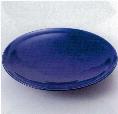
256-207-91 3,500円 ルリ11.0皿(34) 525620791 256-208-91 2,700円 ルリ10.0皿(30) 525620891