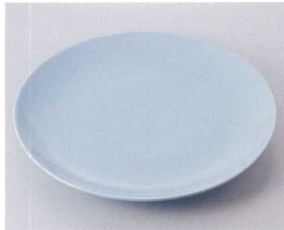
257-301-84 3,900円 青地13.0皿(41.5×5.5) 525730184 257-302-84 2,300円 青地12.0皿(36×3.5) 525730284 257-303-84 1,400円 青地10.0皿(31.5×3) 525730384