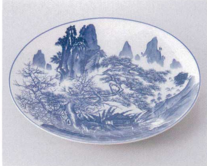
257-106-82 2,250円 古木山水 12.0大皿(37×37×4.5) 525710682 257-107-82 1,300円 古木山水 10.0大皿(31.5×31.5×3.5) 525710782