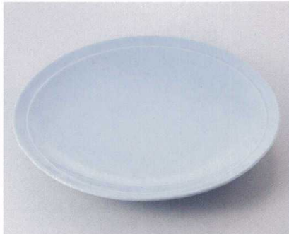
257-402-81 2,650円 高台青磁12.0皿(38×4.5) 525740281 257-403-81 2,300円 高台青磁11.0皿(34.5×4) 525740381 257-404-81 1,900円 高台青磁10.0皿(32×5) 525740481