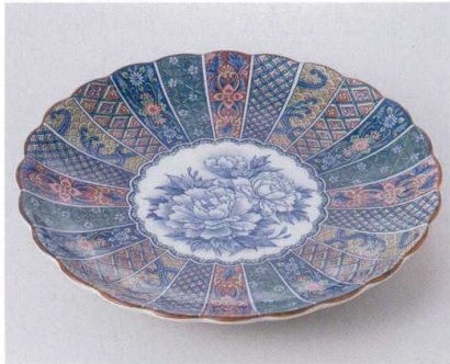
257-307-81 2,000円 染錦10.0皿(32×4) 525730781