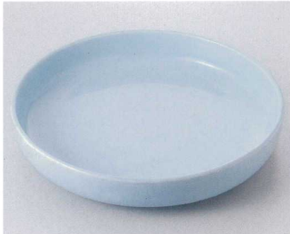
257-405-81 2,250円 青磁10.0盛込鉢(30×6) 525740581