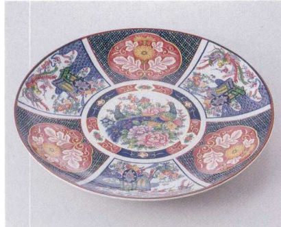
257-201-84 2,500円 孔雀10.0皿(32×3.5) 525720184