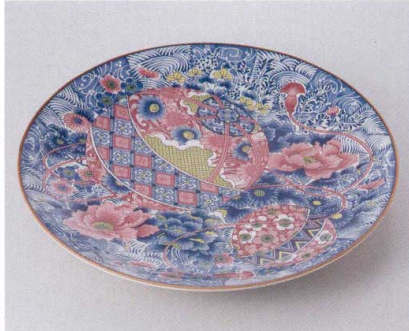
257-202-82 4,600円 てまり 13.0大皿(42×42×5.5) 525720282 257-203-82 2,500円 てまり 12.0大皿(37×37×4.5) 525720382 257-204-82 1,900円 てまり 10.0大皿(32×32×4) 525720482