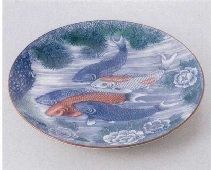
257-205-82 2,500円 5匹鯉 12.0大皿(37×37×4.5) 525720582 257-206-82 1,900円 5匹鯉 10.0大皿(32×32×4) 525720682