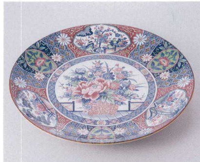
257-401-81 1,900円 花かご 10.0皿(32.5×3.5) 525740181