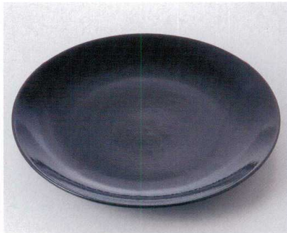
257-304-81 4,600円 ゆず天目13.0丸皿(41.5×5.5) 525730481 257-305-81 2,300円 ゆず天目12.0丸皿(37×3.5) 525730581 257-306-81 1,800円 ゆず天目10.0丸皿(31.5×3) 525730681