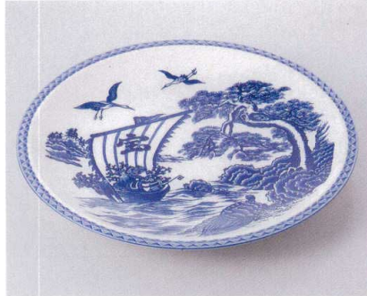
257-101-82 2,250円 宝舟 12.0大皿(36.5×36.5×4) 525710182 257-102-82 1,300円 宝舟 10.0大皿(32×32×3.5) 525710282