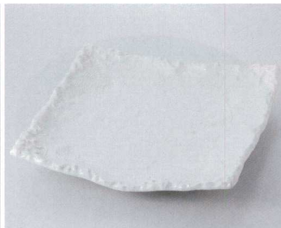
258-302-84 2,500円 白釉四ツ足10.0正角皿(30.5×30.5×5.5) 525830284