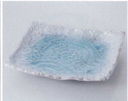
258-203-81 2,700円 青雲10.0長角盛皿(30×24×5) 525820381