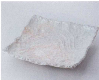
258-301-81 3,300円 粉引10.0正角皿(30×30×5.5) 525830181