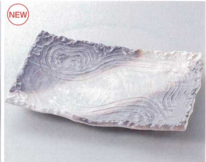
258-103-82 1,800円 志野11.0長角足付(33×20×5) 625810382 258-104-82 3,400円 志野13.0長角足付(37×25×5) 625810482