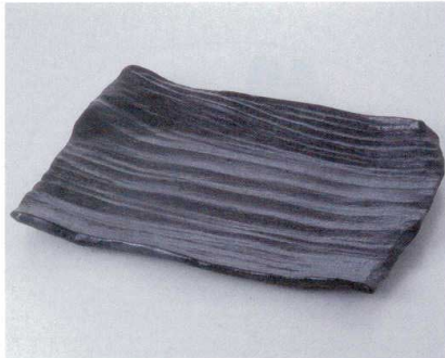
258-101-81 2,300円 いぶし10.0長角皿(31×21.5) 525810181