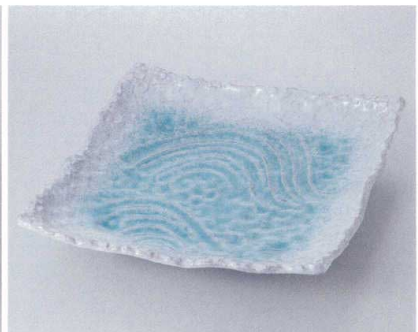
258-303-81 3,200円 青雲10.0正角盛皿(30×30×5.5) 525830381