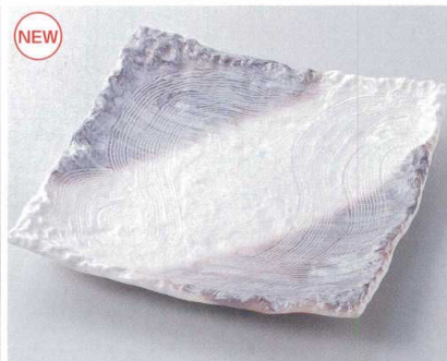
258-405-82 1,600円 志野8号四方皿(26×26×5) 625840582 258-406-82 2,400円 志野10号四方皿(31.5×31.5×5.5) 625840682