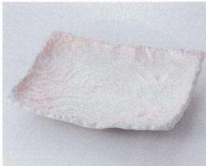
258-201-81 2,800円 粉引10.0長角皿(30×24×5) 525820181