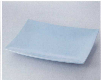
258-407-84 3,000円 青地12.0長角皿(38.5×28.5×5) 525840384