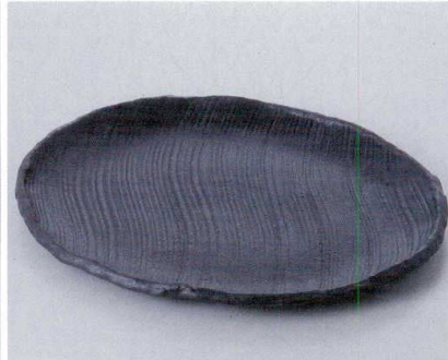
258-102-81 2,400円 いぶし釉10.0楕円皿(32×23) 526040181