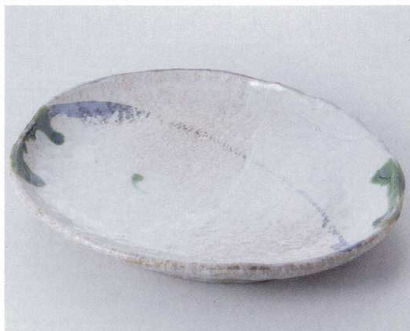
258-401-81 2,700円 織部流10.0小判皿(29.5×24.5×4.5) 525810281 258-402-81 860円 織部流8.0小判皿(24×17×4) 525810381 258-403-81 650円 織部流6.5小判皿(20×14.5×3.5) 525810481 258-404-81 440円 織部流5.5小判皿(17.5×11.5×2.5) 525810581