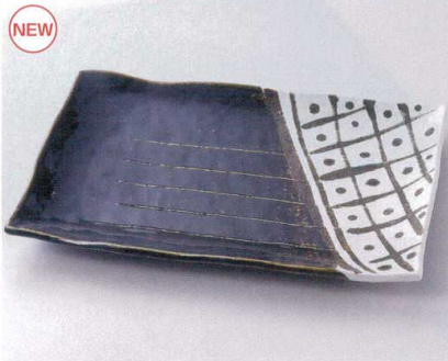
259-403-82 3,800円 天目格子12.0角皿(37×26×3.6) 625940382 259-404-82 2,700円 天目格子11.0角皿(34×23.5×3.6) 625940482 259-405-82 2,200円 天目格子10.0角皿(30×21×3) 625940582 259-406-82 1,700円 天目格子9.0角皿(28.5×18.5×3) 625940682