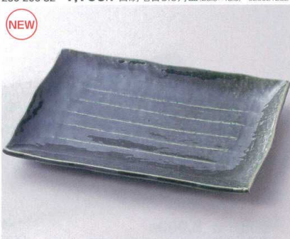
259-309-82 3,800円 織部角皿12.0(37×26) 625931282 259-310-82 2,700円 織部角皿11.0(34×23.5) 625931182 259-311-82 2,200円 織部角皿10.0(30×21) 625931082 259-312-82 1,700円 織部角皿9.0(28.5×18.5) 625930982