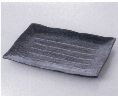
259-103-82 3,800円 油滴天目12.0角皿(37×26) 525910982 259-104-82 2,700円 油滴天目11.0角皿(34×23.5) 525911082 259-105-82 2,200円 油滴天目10.0角皿(30×21) 525911182 259-106-82 1,700円 油滴天目9.0角皿(28.5×18.5) 525911282