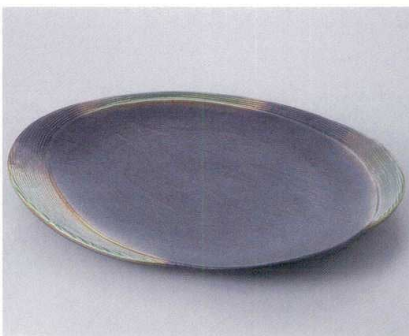
259-202-82 2,700円 12.0鉄織部小判皿(36×26.5×3.5) 525940282