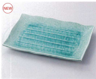
259-301-82 3,800円 青地12.0角皿(37×26×3.6) 625930182 259-302-82 2,700円 青地11.0角皿(34×23.5×3.6) 625930282 259-303-82 2,200円 青地10.0角皿(30×21×3) 625930382 259-304-82 1,700円 青地9.0角皿(28.5×18.5×3) 625930482