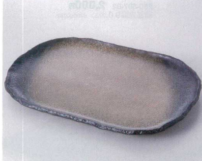
259-401-84 9,300円 櫛目小判皿(手造)(42.5×28×2.5) 526210284