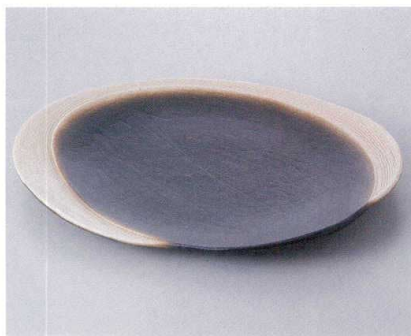
259-201-84 2,700円 黒吹小判盛皿(36×26×3.7) 525940184