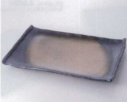
259-402-84 9,300円 櫛目長角皿(手造)(40×26.5×4) 526210184