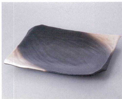
259-101-84 2,700円 黒吹長角盛皿(35.5×27×4) 525930184