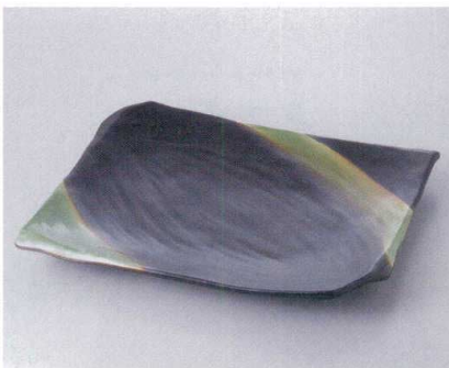
259-102-82 2,700円 12.0鉄織部角皿(35×27×4) 525930282