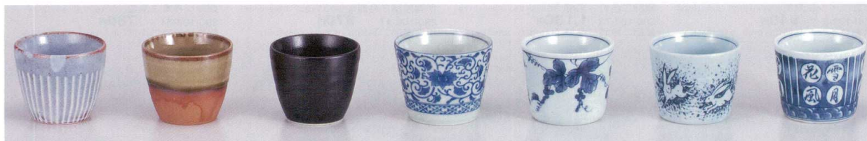
289-201-20 290円 ねずみ十草そば千代口(小) (7.8×6.5-140cc) 529040320 289-202-20 290円 ヒードロそば千代口(小) (7.8×6.5-140cc) 529040220 289-203-20 290円 黒ハケそば千代口(小) (7.8×6.5-140cc) 529040420 289-204-11 450円 藍彩そば猪口 (8.5×6.5) 628920411 289-205-20 320円 ぶどうそば千代口 (8×6.5) 529040620 289-206-20 320円 月うさぎそば千代口 (8×6.5) 529040720 289-207-20 320円 雪月花そば千代口 (8×6.5) 529040520