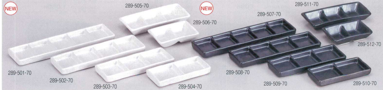
289-501-70 289-502-70 289-503-70 289-504-70 289-505-70 289-506-70 289-507-70 289-508-70 289-509-70 289-510-70 289-511-70 289-512-70 289-501-70 1,000円 白マット五品皿 細口(23.4×6.2×1.8) 628950170 289-502-70 880円 白マット四品皿 細口(20.3×6×1.8) 628950270 289-503-70 680円 白マット三品皿 細口(16.8×6×1.8) 628950370 289-504-70 580円 白マット二品皿 細口(13×6×1.8) 628950470 289-505-70 680円 白マット三品皿 深口(15×6.5×2.3) 628950570 289-506-70 580円 白マット二品皿 深口(9.8×6.5×2.3) 628950670 289-507-70 1,000円 黒マット五品皿 細口(23.4×6.2×1.8) 628950770 289-508-70 880円 黒マット四品皿 細口(20.3×6×1.8) 628950870 289-509-70 680円 黒マット三品皿 細口(16.8×6×1.8) 628950970 289-510-70 580円 黒マット二品皿 細口(13×6×1.8) 628951070 289-511-70 680円 黒マット三品皿 深口(15×6.5×2.3) 628951170 289-512-70 580円 黒マット二品皿 深口(9.8×2.3) 628951270