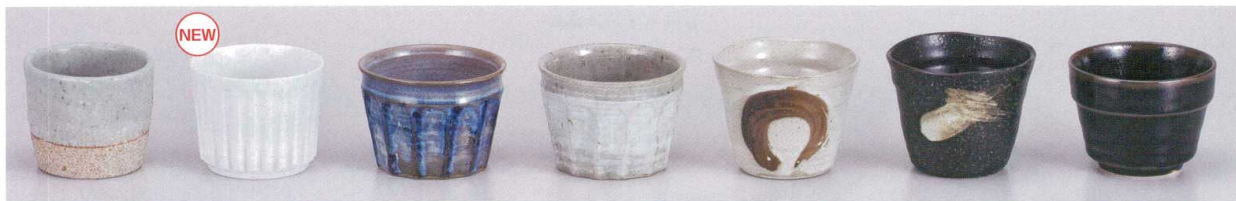
289-101-74 900円 穴窯釉そば千代口 (8.2×5.7) 529030274 289-102-75 600円 白磁 面取そば千代口 (8.2×6.7) 628910275 289-103-51 470円 角ソギ灰釉コスソバ千代久 (6.2×6.5) 529030651 289-104-51 470円 角ソギ青磁刷毛ソバ千代久 (6.2×6.5) 529030551 289-105-60 360円 粉引刷毛そばチョコク (9×7.1-220cc) 529030760 289-106-60 360円 天正黒そば千代口 (9×7-220cc) 528810760 289-107-54 400円 ゆず天目そば千代口 (9×6.8) 529040154