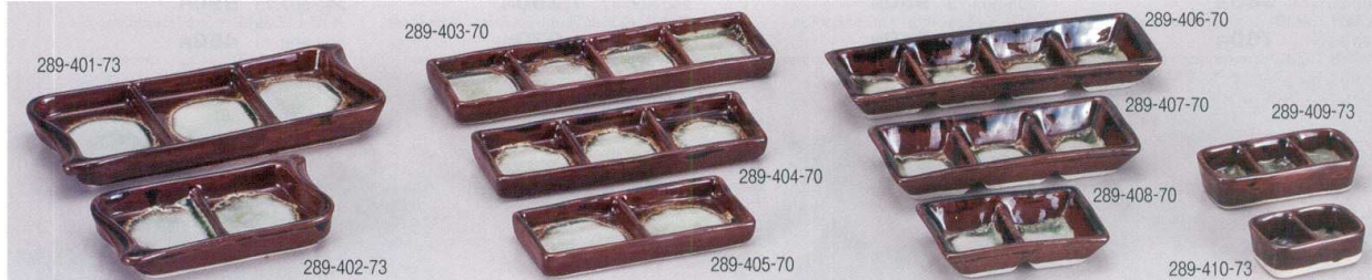
289-401-73 289-402-73 289-403-70 289-404-70 289-405-70 289-406-70 289-407-70 289-408-70 289-409-73 289-410-73 289-401-73 810円 竹形三品盛(20×9×2.5) 529130173 289-402-73 590円 竹形二品盛(13.5×8×2.5) 529130273 289-403-70 850円 オフケ細型四品盛(20.3×6.1×1.8) 529130371 289-404-70 660円 オフケ細型三品盛(16.8×6×1.8) 529130471 289-405-70 560円 オフケ細型二品盛(13×6×1.8) 529130571 289-406-70 850円 オフケ四品皿 深口(19.3×6.3×2.3) 628940670 289-407-70 660円 オフケ三品皿 深口(15×6.5×2.3) 628940770 289-408-70 560円 オフケ二品皿 深口(9.8×6.5×2.3) 628940870 289-409-73 580円 オフケミニ三品盛(9.2×4.3×2.2) 529130973 289-410-73 450円 オフケミニ二品盛(6.2×4.3×2.2) 529131073