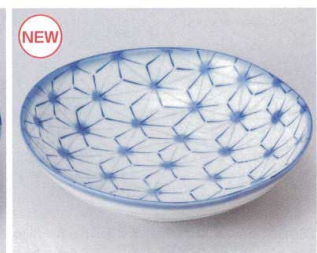
295-504-35 460円 麻の葉 6.8深皿(21.1×5.2) 629550435