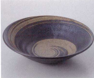
295-102-25 1,800円 武蔵野リップル8.0鉢(26.2×7) 529710125