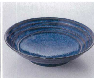
295-303-62 1,000円 雲海8.0大鉢(25×6.3) 529740362