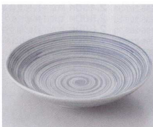
295-402-54 750円 細刷毛目(グレー)7.5めん皿(23×5) 529740454