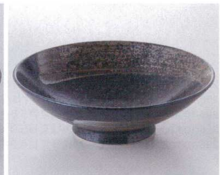
295-204-54 1,150円 明世荒刷毛8.0盛鉢(24.5×8) 529740154