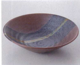
295-101-33 1,800円 朱華リップル8.0鉢(26.5×7) 529710233