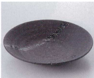
295-302-5 1,050円 彗星リップル7.5皿(23.2×4.5) 529730405