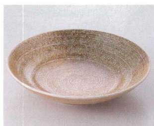
295-501-63 650円 信濃路7.5浅鉢(23×5) 529750463