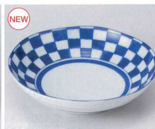
295-503-35 460円 市松 6.8深皿(21.1×5.2) 629550335