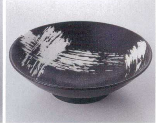
295-104-1 1,600円 黒地白刷毛8.0盛鉢(25×7.5) 529720201