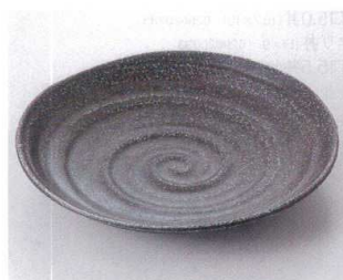
295-401-61 760円 彩華藍8.0バスタ皿(23×3.7) 529750361