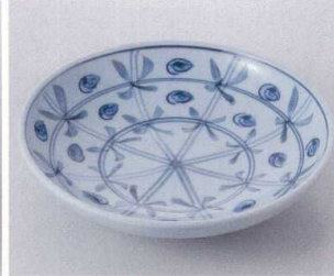
295-103-33 1,700円 うず格子7.5深皿(23×5) 529710433