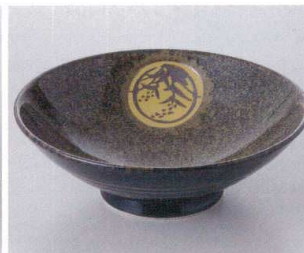
295-203-54 1,150円 錦天目丸紋8.0盛鉢(24.5×8) 529730354