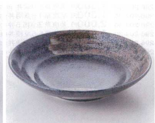
295-404-54 650円 明世荒刷毛 7.5めん皿(23×5) 529750154