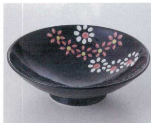
295-301-54 1,150円 花かざり8.0盛鉢(24.5×8) 529730254