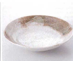
295-403-54 650円 雪志野 7.5めん皿(23×5) 529750254