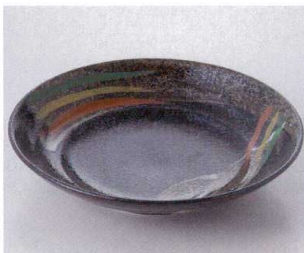
295-202-5 1,400円 荒刷毛三彩7.5めん皿(22.8×5) 529720305