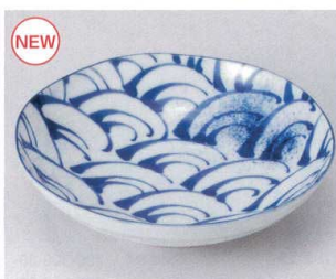
295-502-31 460円 青海波麵皿(21×5.2) 629550231