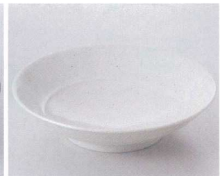
295-304-28 980円 雪粉引8.0鉢(25×6.3) 529740228