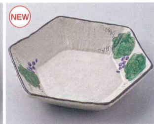
31-504-17 1,300円 ぶどう六角鉢 (18.8×16.7×4) 603150417