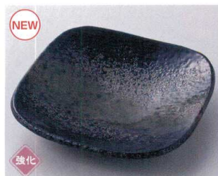
31-501-73 1,400円 黒緑彩向付 (15.5×3.4) 603150173