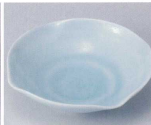
31-203-35 1,500円 青白四ツ押し身鉢 (17×17×4.5) 503810135