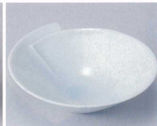
31-304-74 1,400円 うすあさぎ向付 (17×5) 503840174