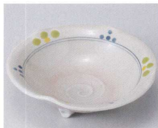
31-401-73 1,400円 萩風早春三ツ足5.0浅鉢 (15×4) 503840473