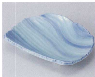
31-301-34 1,500円 青磁流水彫6.0皿 (18.5×14×4) 503820134