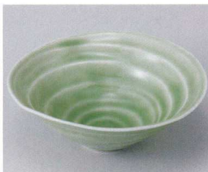
31-502-47 1,350円 ヒスイうず潮5.0鉢 (16×15.2×5.5) 503850147