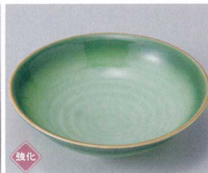
31-303-78 1,440円 緑彩向付 (15.7×4.3) 503830278