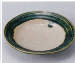
31-403-34 1,380円 測織部5.5深皿 (17×3.5) 503850434