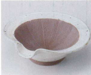
31-102-20 1,600円 粉引片口鉢(クシメ付) (17×5.7) 503740320