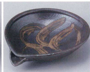
31-404-31 1,480円 泥刷毛茶マツ5.0片口平鉢 (16.6×14.7×4) 503820431