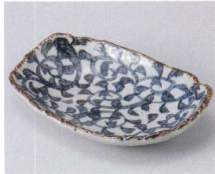
31-101-5 1,680円 タコ唐草中鉢 (22×14.5×4.5) 503740205