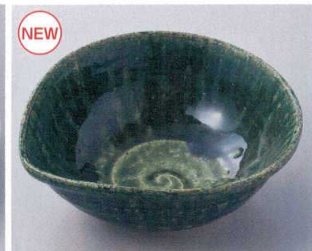
31-204-52 1,500円 織部 片口鉢 (15.3×14×6) 603120452