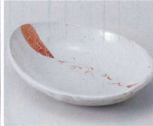
31-103-56 1,600円 赤絵流紋取鉢 (17×13×4) 503750456