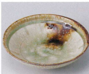
31-402-25 1,400円 伊賀ビードロ5.5浅鉢 (17×4.3) 503830425