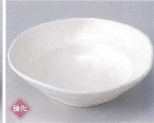
31-104-70 1,600円 クリーム向付 (15.7×4.8) 503820277