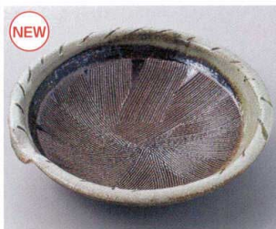
31-302-31 1,400円 泥クン彫5.0片口平すり鉢 (15.2×4.1) 603130231