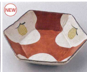
31-503-17 1,300円 赤濃樺六角鉢 (18.8×16.7×4) 603150317