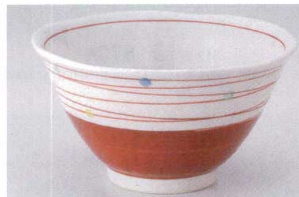
311-301-74 2,150円 点彩渦多用井(赤)(18×9) 531130174