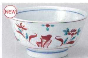
311-601-2 1,200円 赤絵万歴5.0井(16×8.5) 631160102