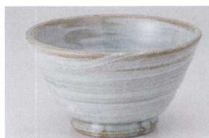
311-501-33 1,450円 白化粧切立5.0多用井(15×8.5) 531160133