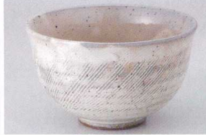
311-102-58 2,150円 粉引櫛目反井(14.5×9) 531130358