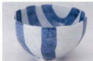
311-401-35 1,900円 帯十草5.0井(15.8×9.6) 531140135