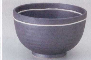
311-205-57 2,200円 明世黒5.0多用井(15.5×9.8) 531120657