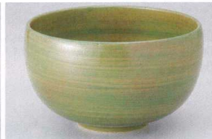
311-303-2 2,000円 雲母全井(大)(15.4×9.3) 531130402 311-304-2 1,100円 雲母全井(中)(13×7.4) 531130502 311-305-2 830円 雲母全井(小)(10.9×6.7) 531130602