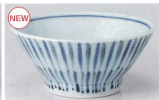
311-504-40 1,550円 京十草 大茶井(16.5×7.5) 631150440