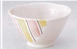
311-306-78 1,980円 彩時空・風5.0井(15.5×8.5) 531150177