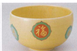
311-602-2 1,300円 福祿寿黄井(大)(15.4×9.3) 531160402 311-603-2 850円 福祿寿黄井(中)(13×7.4) 531160502 311-604-2 750円 福祿寿黄井(小)(10.9×6.7) 531160602