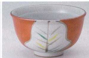
311-402-30 1,900円 赤木の葉5.0多用井(15.3×8.7) 531140330