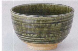
311-201-57 2,300円 織部釉5.0多用井(15.8×10) 531120257 311-202-57 1,650円 織部釉4.5多用井(14×9.2) 531120357 311-203-57 1,400円 織部釉4.0多用碗(12.5×7.5) 531120457