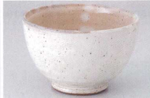
311-204-51 2,250円 粉引夏目井(15.5×9.5) 531120551