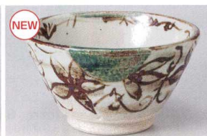
311-503-33 1,900円 織部てっせん切立5.0井(15×8.5) 631150333