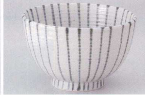
311-103-30 2,400円 古染十草5.0深井(15.5×10) 531110430