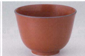
311-403-31 1,500円 朱赤4.8深井(14.4×10) 531150331