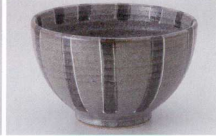
311-104-33 1,850円 十草5.0京井(15.5×9.5) 531150233