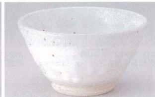
311-404-33 1,450円 白唐津切立5.0多用井(15×8.5) 531160233