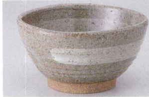
311-101-52 2,700円 土灰釉たわみ5.5井(16.5×9) 531110252