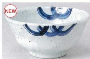
311-502-35 1,400円 まじわり手作り風中鉢(17×16.5×8.3) 631150235