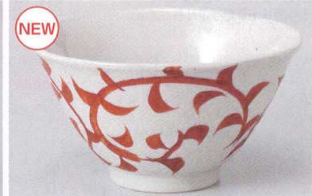
311-206-74 2,150円 赤絵唐草多用井(15.9×8.4) 631120674