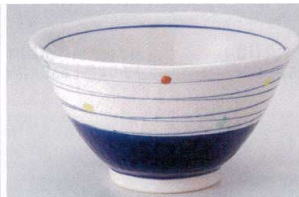
311-302-74 2,150円 点彩渦多用井(紺)(18×9) 531130274