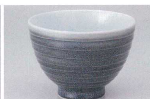
311-605-25 950円 朝もや千段5.0井(15.0×10.7) 531150425