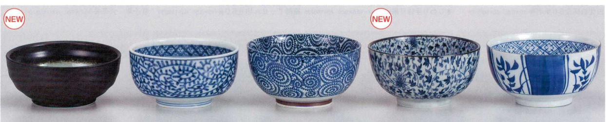
312-501-40 690円 姫胡蝶 京碗 大(16×7) 631250140 312-502-40 470円 姫胡蝶 京碗 中(13.5×6.5) 631250240 312-503-28 660円 タコ唐草大井(15.2×8) 531250228 312-504-28 660円 古染タコ唐草お好み井(大)(16×8.5) 531250428 312-505-52 600円 菊唐草5.0井(15.8×8.4) 631250552 312-506-40 580円 彩遊5.0京碗(16.3×8.5) 531250640