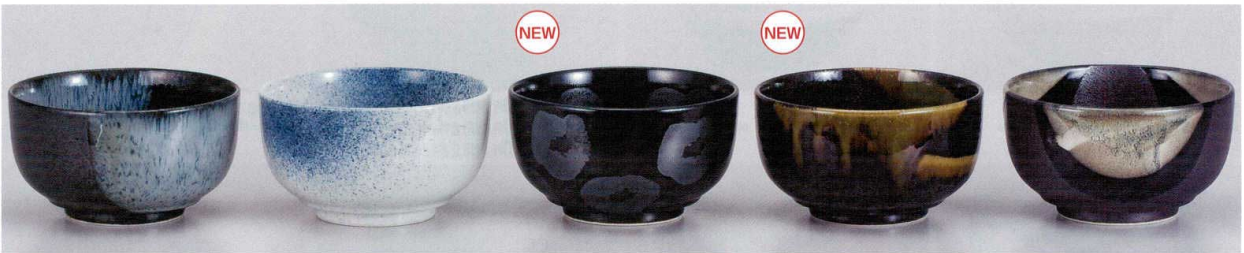
312-301-62 750円 黒結晶白流京井(15.5×9) 531240362 312-302-62 750円 吹墨京井(15.5×9) 531240262 312-303-62 750円 銀結晶 京井(15.5×9) 631230362 312-304-62 750円 天の川 京井(15.5×9) 631230462 312-305-62 750円 美濃益子京井(15.5×9) 531230562