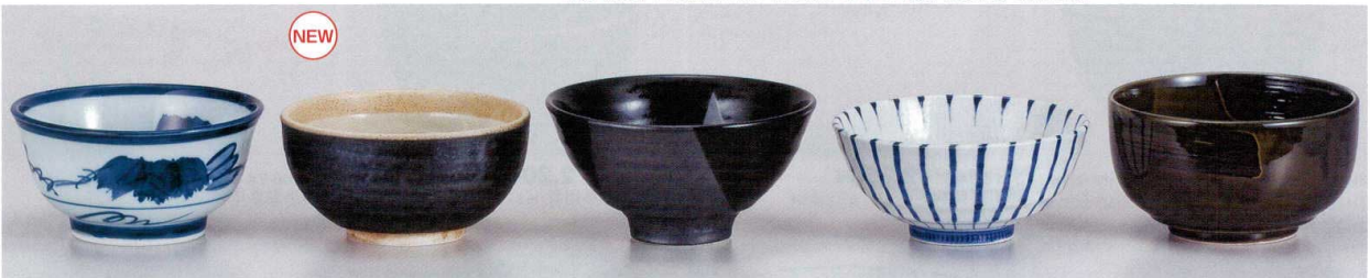
312-201-33 1,000円 野ぶどう5.0反井(15.8×8.2) 531220233 312-202-62 1,100円 白樺 石目 5.0井(15.5×7.7) 631220262 312-203-62 830円 白樺 石目 4.2井(13×7.5) 631220362 312-204-62 700円 白樺 石目 4.0井(12.5×7.2) 631220462 312-205-34 1,100円 夜宙けずり5.8井(17.2×8.8) 531220134 312-206-31 900円 トチリ呉須十草5.0丸井(16×7.3) 531220331 312-207-58 870円 撥水オリベ剛毛5.0深井(15.9×8.8) 531220558