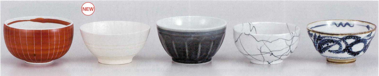
312-101-5 1,650円 赤巻削り十草たっぷり井(15.5×9.3) 531210105 312-102-26 1,500円 白マット二本ラインサラダボール(15.3×7) 631210226 312-103-25 1,350円 朝もや面取り5.5井(16.2×8.8) 631210225 312-104-25 850円 朝もや面取り4.5井(13.7×7.1) 531210325 312-105-34 1,230円 ホタル5.0井(16.2×7.6) 531210634 312-106-34 830円 ホタル4.0井(12.5×7.5) 531210734 312-107-25 1,150円 波唐草5.0お好み井(16.2×8.2) 531210525