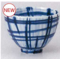
317-203-31 1,250円 ささら格子ノッポ丼(大) (11.5×8.2) 631720331 317-204-31 1,150円 ささら格子ノッポ丼(小) (11.5×8.2) 631720431