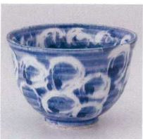
317-105-33 1,750円 輪つなぎ4.0多用碗 (12.8×8.8) 531710533