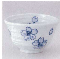
317-201-20 1,550円 ゴス桜変型中丼 (14.2×13.2×8.5) 531720120