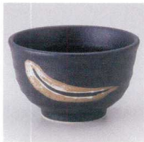
317-501-56 850円 漁火4.0多用丼 (12.2×7.3) 531750156