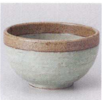
317-304-60 650円 白露石目4.2丼 (13.1×7.5) 544200560