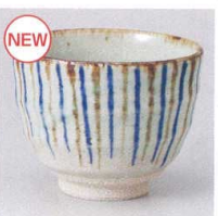
317-207-31 1,100円 二色十草多用碗 (10.5×8.5) 631720731