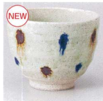
317-301-31 1,100円 青磁水玉多用碗 (10.5×8.5) 631730131