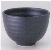
317-402-47 900円 黒マット小丼 (12×8.5) 531740347