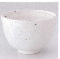
317-505-35 800円 軽ター珍トクサ小丼白 (12.5×8.5) 531750635