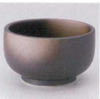
317-503-15 820円 黒伊賀4.0多用碗 (13.3×8) 531750315