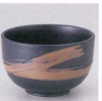
317-605-25 600円 いぶし天目4.0丸丼 (12.7×8) 531760425