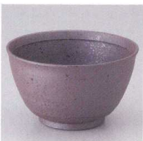
317-205-2 1,200円 南蛮丼 (13×7) 531730202