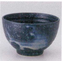
317-602-62 630円 黒流多用丼 (12.7×7.8) 531760562