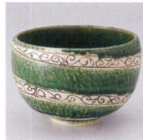
317-101-35 3,200円 織部渦巻福々丼 (12.4×9) 531710135