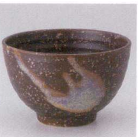
317-603-62 630円 茶流多用丼 (12.7×7.8) 531760662