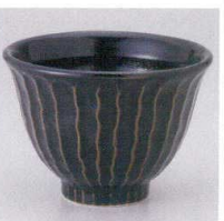
317-306-62 900円 柚子天目のぎ小丼 (12.3×8.8) 531740162