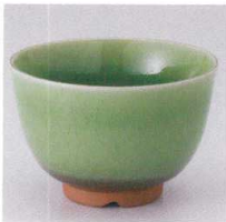
317-601-16 720円 もえぎ多用碗 (12×8) 531760316