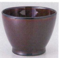
317-106-51 1,550円 うるしブラウン姫丼 (12×9) 531720251