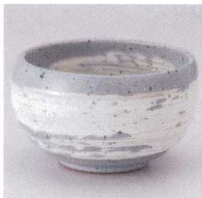
317-103-25 1,850円 粉引刷毛おかゆ碗 (13×7.5) 531710325