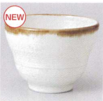
317-403-25 950円 白結晶測茶流し瓢形小丼 (13.2×9.4) 631740325