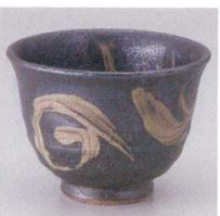
317-206-31 1,180円 泥刷毛茶マット反多用碗 (12×8.8) 531730331