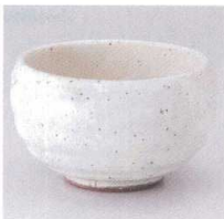
317-104-25 1,850円 粉引おかゆ碗 (13×7.5) 531710425