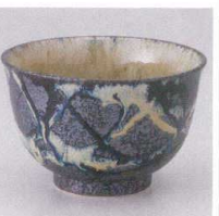
317-406-31 860円 ウノフ乱十草4.3多用丼 (12×8) 531740631