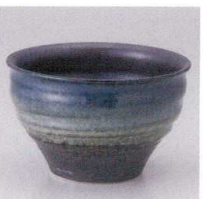
317-305-78 910円 均窯ブルー多用丼 (13×8.2) 531740478