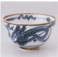
317-502-25 830円 波唐草4.5お好み丼 (13.3×8) 531750225