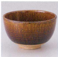
317-302-31 1,050円 あめ釉4.0多用碗 (12.3×7.4) 531730231