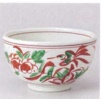
317-404-31 950円 手描花鳥4.0丼 (12.5×7) 631740431