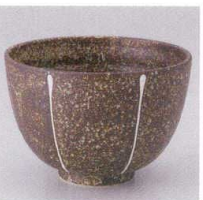
317-504-35 800円 軽ター珍トクサ小丼茶 (12.5×8.5) 531750535