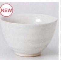
317-606-31 570円 京志野多用碗 (12×8) 631760631