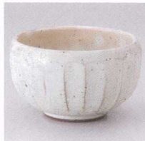
317-102-46 2,000円 粉引面取り4.0鉄鉢丼 (12.5×8) 531710246