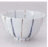
317-405-35 850円 内外十草4.5お好み丼 (13×8) 531740535