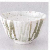
317-506-33 780円 白マット十草お好み碗 (13.3×8) 531760133