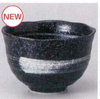
317-604-31 620円 黒水晶多用碗 (12×7.5) 631760431