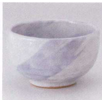
317-202-25 1,500円 紫におい夏目4.0丼 (12.5×7.6) 531720225