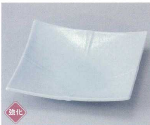
強化 32-401-5 1,200円 青磁四筋入り正角皿 (17.3×17.3×4) 503920405