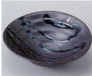
32-103-47 1,580円 黒織部流しうず潮6.0鉢(18×17.3×6) 522310347 32-104-47 1,350円 黒織部流しうず潮5.0鉢(16×15.2×5.5) 503910347