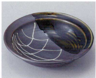
32-304-70 1,300円 掛アミ南蛮円付5.5丸鉢 (17.6×4.8) 503920271