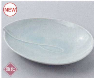
NEW 強化 32-503-34 1,100円 (強化)青白磁とじめ向付 (20×15.3×3.5) 603250334