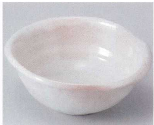
32-204-16 1,350円 白灰流 深小鉢 (16×14×6) 503910416