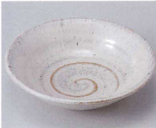
32-101-26 1,450円 乳白平鉢 (15.7×4.2) 503830126