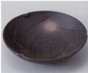
32-502-2 1,100円 備前風向付 (16×4.3) 503950102