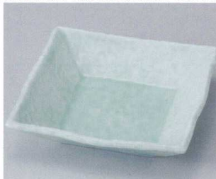
32-203-26 1,300円 もえぎ正角5.0平鉢 (16×16×3.8) 503850326