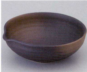
32-102-24 1,500円 黒備前片口5.0鉢 (16.7×16.2×5.5) 522640324