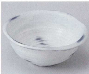
32-402-16 1,200円 化粧流向付 (15.7×14×6.3) 503930416