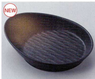
NEW 32-403-35 1,180円 波目丸皿 備前 (18.2×14.5×3.7) 603240335