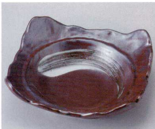
32-201-24 1,350円 白刷毛正角鉢(大) (16.2×16×5.8) 503910224