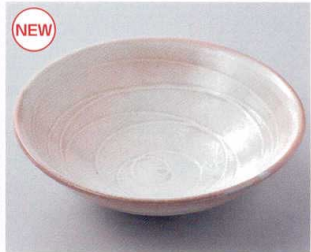
NEW 32-105-74 1,400円 粉引向付 (14.7×5) 503840274