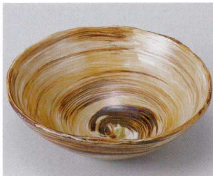
32-202-74 1,400円 よもぎ向付 (16.5×5.6) 503840374