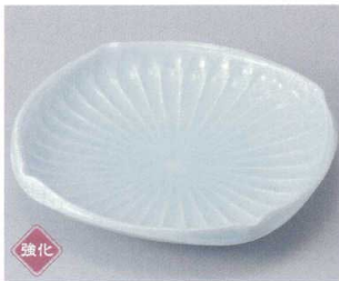
強化 32-302-5 1,300円 青白磁彫向付 (17.3×17.3×3.5) 503920105