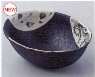
NEW 32-504-35 1,080円 いぶし山里 楕円深鉢 (17×13.7×6.3) 603250435