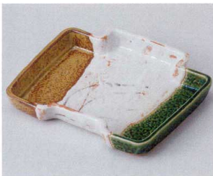
32-301-78 1,330円 三彩芦変型角皿 (15.2×13.6×2.1) 503850278