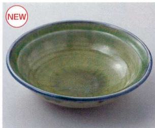
NEW 32-303-79 1,300円 灰釉流し5.5鉢 (17×3×4.8) 603230379