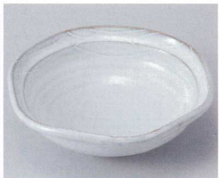
32-404-74 1,200円 白樺六角向付 (14.3×14.7×4.5) 503930274