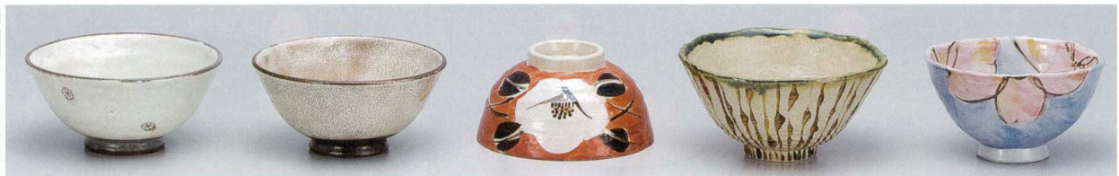
328-301-34 1,700円 (手造り)粉引印花茶碗 (12.5×6) 532830334 328-302-34 1,700円 (手造り)かいらぎ茶碗 (12.5×6) 532830434 328-303-70 1,660円 赤濃山茶花茶碗 (11×5.8) 532830571 328-304-30 1,550円 織部十草飯碗(大) (13×6.7) 532840730 328-305-35 1,650円 ピンク桜茶碗 (11×11×5.8) 532830635