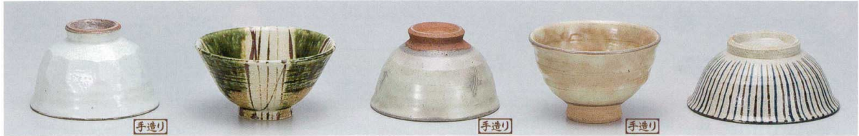
328-101-17 2,300円 手造り粉引面取茶碗 (11×7) 532810317 328-102-15 2,000円 織部糸巻茶碗 (12×6) 532810515 328-103-17 2,000円 手造り粉引えくぼ茶碗 (11.4×6.8) 532820117 328-104-17 2,000円 手造り粉引茶碗 (11×6.7) 532810617 328-105-78 1,920円 麦わら十草大平 (13×5.8) 532820378 328-106-78 1,780円 麦わら十草中平 (11.5×5.8) 532820478