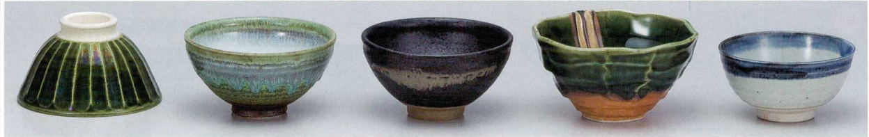
328-501-5 1,500円 織部しのぎ茶碗 (12×6.8) 532850205 328-502-24 1,500円 グリーン飯碗 (12.6×6.5) 532850324 328-503-24 1,500円 燻飯碗 (12.6×6.5) 532850424 328-504-35 1,380円 織部十草八角小井 (13.5×7.5) 532850535 328-505-34 1,350円 (手造)おふけ藍流し丸碗 (11.2×5.8) 532850634