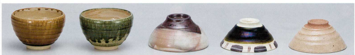
328-401-5 1,600円 黄瀬戸多用碗 (10.8×7) 532840105 328-402-5 1,600円 織部多用碗 (10.8×7) 532840205 328-403-70 1,600円 窯変粉引掛分中平 (11.7×5.8) 532840471 328-404-70 1,600円 窯変粉引掛分大平 (12.2×6) 532840371 328-405-78 1,600円 絵オリ飯碗 (10.7×5.2) 532840578 328-406-78 1,600円 粉引平飯碗 (10.7×5.2) 532840678