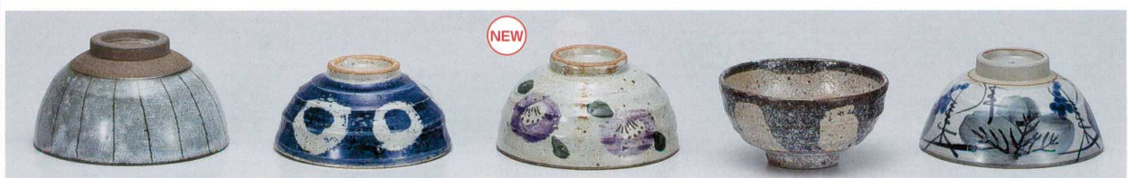
328-601-24 1,100円 ガラス十草大平 (12.3×6.8) 532930424 328-602-24 1,050円 ガラス十草中平 (11.3×6.3) 532930524 328-603-24 920円 呉須丸紋大平 (11.5×6) 532950124 328-604-24 830円 呉須丸紋中平 (10.8×5.7) 532950224 328-605-51 920円 紫椿大平 (11.5×6.2) 632860551 328-606-51 830円 紫椿中平 (11×5.6) 632860651 328-607-24 920円 茶刷毛大平 (11.5×6) 533330724 328-608-24 830円 茶刷毛中平 (10.8×5.7) 533330824 328-609-51 700円 粉引ぶどう茶碗(小) (11×5.4) 533040151 328-610-51 700円 粉引ぶどう茶碗(大) (11.8×5.8) 533040251