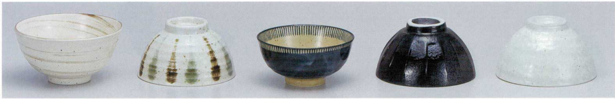
330-601-28 430円 サビ粉引飯碗 (12.6×6.6) 533150428 330-602-35 420円 二彩茶碗 (11.3×6.5) 533150535 330-603-57 390円 唐津トクサ丸碗 (11×5.5) 533150657 330-604-40 510円 黒金彩吹飯碗 (11.5×6.5) 533140440 330-605-62 480円 新粉引飯碗 (12.5×6.5) 533140562