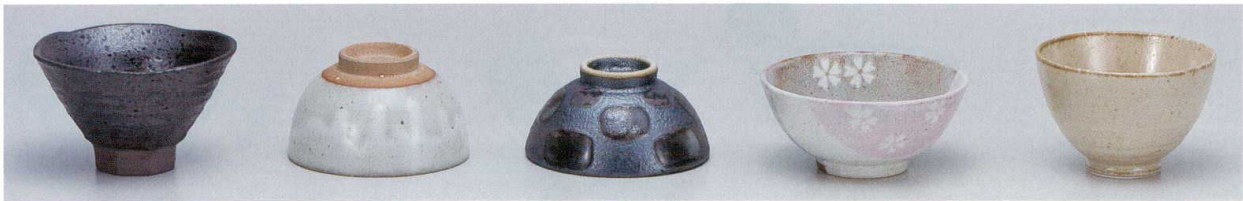
330-201-58 690円 高台黒吹茶碗 (12×7) 533040558 330-202-7 660円 うのふ大平 (11.5×6.5) 533050207 330-203-7 660円 うのふ小平 (10.6×6.2) 533050307 330-204-46 650円 黒市松中丸 (11.5×5.7) 533060446 330-205-46 550円 黒市松小丸 (10.5×5.5) 533060546 330-206-24 640円 志野桜中平 (12×5.5) 533060624 330-207-25 670円 うす茶うのふ茶碗 (10.5×7.1) 533050725