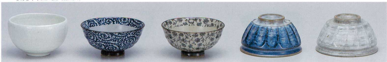
330-401-15 600円 白吹飯器身 (11×7.5) 533120215 330-402-58 580円 古染タコ唐草茶碗 (12×6) 533120458 330-403-58 580円 古染唐花茶碗 (12×6) 533120558 330-404-51 620円 角ソキ灰釉ゴス茶碗 (11.4×6.3) 533110351 330-405-51 620円 角ソキ青磁刷毛茶碗 (11.4×6.3) 533110451