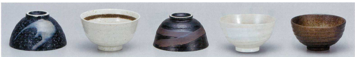
330-501-62 480円 黒流飯碗 (12×6.8) 533140662 330-502-25 600円 うのふ碗 (12.2×7.0) 533130125 330-503-25 560円 いぶし天目飯碗 (11.2×6.4) 533130425 330-504-63 650円 志野備前飯碗 (11×6.2) 533130363 330-505-15 540円 黒備前茶碗(大) (12.4×6.5) 533130615 330-506-15 480円 黒備前茶碗(中) (11.5×6) 533130715