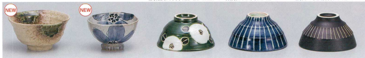
331-201-47 1,490円 伊賀織部ろくへ型茶碗(中) (14×7.4) 633120147 331-202-47 1,190円 伊賀織部ろくへ型茶碗(小) (11.2×5.6) 633120247 331-203-46 1,270円 ひし葉 飯碗(大) (10.8×7) 633120346 331-204-46 1,270円 ひし葉 飯碗(小) (10×6) 633120446 331-205-78 1,250円 織部椿飯碗(小) (11.5×6) 533240378 331-206-78 1,250円 織部椿飯碗(大) (12.2×6.4) 533240478 331-207-24 1,100円 御深井青十草小井 (11.8×7.5) 533260924 331-208-24 860円 御深井青十草ちび井 (11.5×6) 533261024 331-209-24 1,100円 黒マット小井 (11.8×7.5) 533261124 331-210-24 860円 黒マットちび井 (11.5×6) 533261224