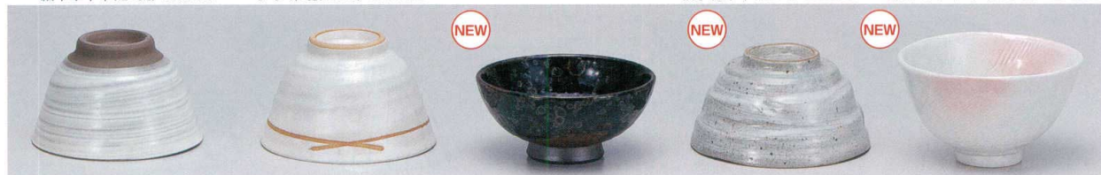
331-401-11 750円 唐津刷毛目茶碗 (11×7) 633140111 331-402-11 750円 粉引ライン茶碗 (11×7) 633140211 331-403-2 680円 油滴天目大平 (12.3×6) 633140302 331-404-2 650円 油滴天目中平 (11.5×5.5) 633140402 331-405-57 520円 青磁刷毛目ソギ茶碗 (11.7×6.3) 633140557 331-406-24 540円 あけぼのしっくり碗 (12×7) 633140624