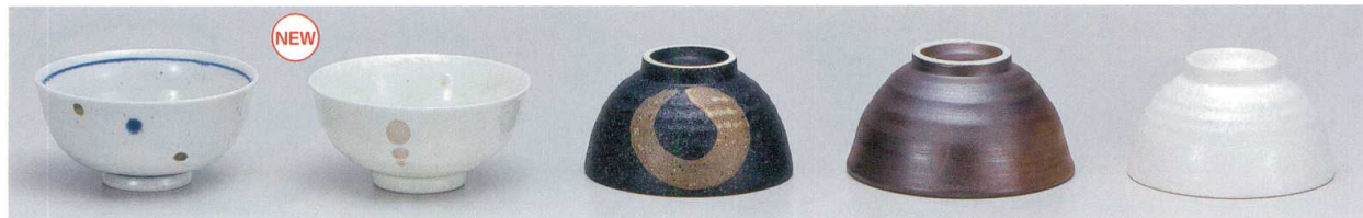
331-601-28 380円 水玉中平 (11.7×5.8) 533160328 331-602-40 350円 白マットドット丸碗 (11.5×5.5) 633160240 331-603-52 320円 黒結晶丸紋中平 (10.5×6) 533160652 331-604-24 330円 優炎中平 (12×6.5) 533160424 331-605-52 320円 白均窯中平 (10.5×6) 533160552