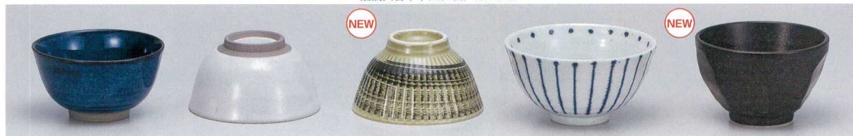
331-501-52 450円 土物都ナマコ中平 (10.5×6) 533150252 331-502-52 450円 土物都白中平 (10.5×6) 533150152 331-503-35 400円 十草彫ハケメ飯碗 (11×6.5) 633150335 331-504-28 400円 古染十草飯碗 (12.6×6.6) 533160128 331-505-35 400円 黒けずり型多盛碗小 (11.3×7.3) 633150535