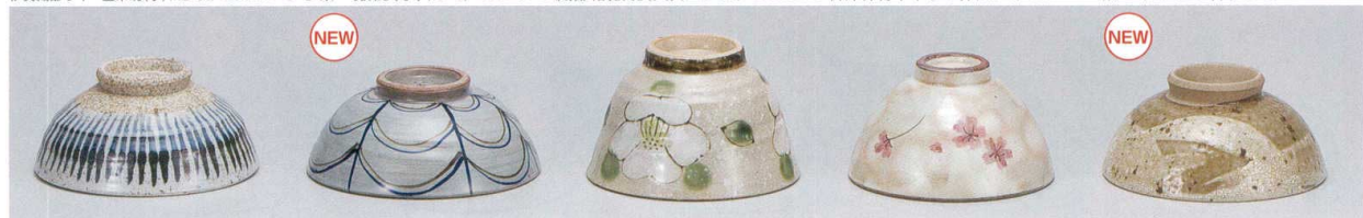
331-301-78 970円 細十草大平 (13×6) 533320977 331-302-78 920円 細十草中平 (12×5.5) 533321077 331-303-2 780円 よし 反茶碗 (12×5.5) 633130302 331-304-2 780円 よし 茶碗 (12.5×5) 633130402 331-305-11 850円 織部つばき飯碗 (11×7) 633130511 331-306-57 780円 萩小花大平 (11.5×6.5) 533350357 331-307-57 730円 萩小花中平 (10.5×6) 533350457 331-308-2 700円 茶カイラギ 大平 (12.5×6) 633130802 331-309-2 680円 茶カイラギ 中平 (12×5.5) 633130902