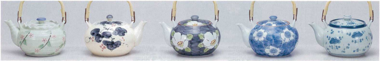
342-501-91 2,200円 しだれ花 4号土瓶(M) (500cc) 634250191 342-502-91 2,300円 ぶどう 4号土瓶(M) (500cc) 634250291 342-503-91 2,300円 白花 4号土瓶 (500cc) 634250391 342-504-91 2,200円 ヤリ梅4号土瓶 (500cc) 534150491 342-505-91 2,300円 花の舞4号土瓶 (580cc) 534060191