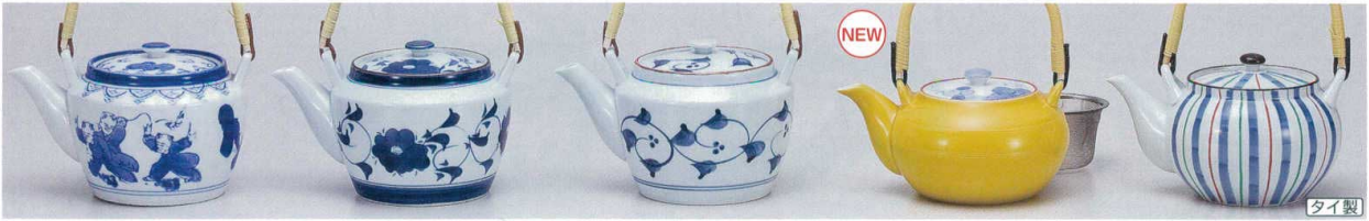
342-601-91 2,200円 唐子4号土瓶 (600cc) 534150591 342-602-91 2,400円 アイ染唐草4号土瓶(M) (600cc) 534050291 342-603-91 2,400円 点唐草4号土瓶(M) (600cc) 534050191 342-604-90 3,300円 黄釉ぶどう4号土瓶(U) (400cc) 634260490 342-605-90 2,400円 古代十草 4号土瓶(M) (600cc) 534050390