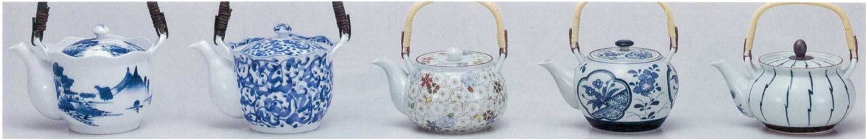
342-101-90 5,800円 山水土瓶(セラ茶コシ) (750cc) 534010190 342-102-90 5,500円 淡彩唐草土瓶(セラ茶コシ) (750cc) 534010290 342-103-91 3,000円 らんまん4号土瓶(M) (550cc) 534010591 342-104-91 3,100円 古染万歴4号土瓶(M) (400cc) 534010491 342-105-91 3,200円 十草山水 4号土瓶 (600cc) 634210591