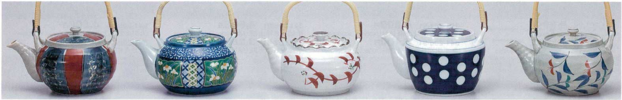
342-301-90 2,800円 桜川4号土瓶(M) (550cc) 534030190 342-302-91 2,700円 グリーンアヤメ4号土瓶 (400cc) 534030391 342-303-91 2,500円 錦唐草4号土瓶(M) (500cc) 534040491 342-304-91 2,900円 水玉4号土瓶 (650cc) 534020591 342-305-90 2,700円 思い花4号土瓶(M) (550cc) 534040290