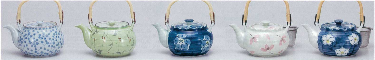
342-401-91 2,500円 ひだまり4号土瓶(M) (550cc) 534040591 342-402-91 2,450円 うず唐草4号土瓶 (550cc) 534060391 342-403-91 2,200円 白梅4号土瓶(M) (500cc) 534060491 342-404-90 2,200円 花吹雪4号土瓶(U) (550cc) 534150290 342-405-90 2,300円 唐白梅4号土瓶(U) (550cc) 534150390