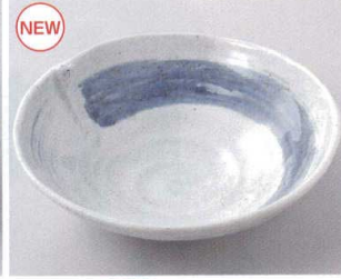
35-104-51 690円 清瀬翔煮物鉢 (17.4×16×4.8) 603510451