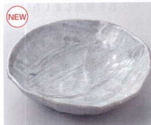
35-201-57 670円 青地刷毛目手折三ツ足平鉢 (16.5×4.5) 603520157