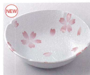
35-501-58 460円 白雪桜5.0鉢 (16×4.8) 603550158