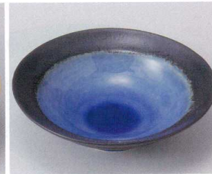
35-504-54 390円 深海(ブルー)5.0平鉢 (16.3×4.5) 504150454