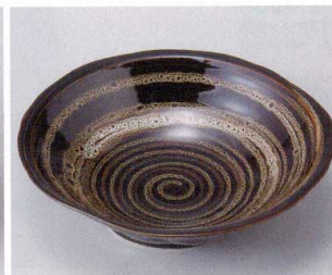
35-402-16 580円 天目巻渦向付 (15.5×4.3) 504140216