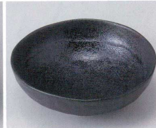
35-404-35 500円 黒釉5.0鉢 (16×5.7) 504140435