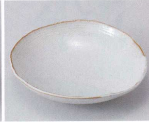
35-204-25 660円 黄化粧土18cm楕円皿 (18×15×3.5) 504130125