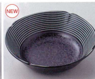
35-502-58 460円 黒釉ライン桜中鉢 (16.3×5) 603550258