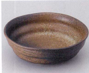
35-101-63 750円 黒備前角浜5.0鉢 (16×5) 522740463