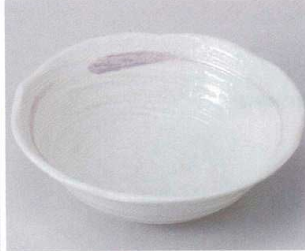
35-102-52 740円 吉祥5.5鉢 (16.5×5) 504120152