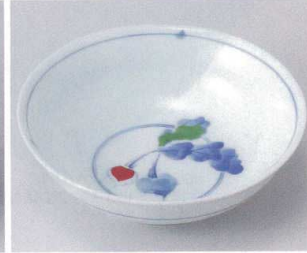
35-304-61 600円 錆かぶ煮物鉢 (15.5×4.5) 504140161