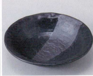
35-103-34 700円 夜宙石目5.0鉢 (16.5×4.2) 504120234