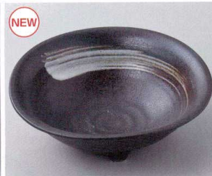
35-202-35 680円 白刷毛天目大鉢 (16.8×16.8×5.3) 603520235