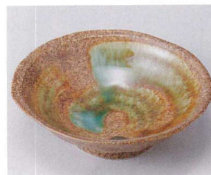
35-401-16 580円 青彩マーブル向付 (15.3×4.5) 504130416