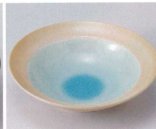
35-503-56 370円 水色平鉢 (16.4×4.7) 504150356