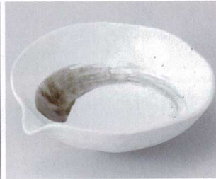
35-203-58 670円 粉引刷毛片口平鉢 (17×5) 504120358