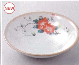
35-302-2 650円 さざんか 5.5浅鉢 (16.5×4.5) 603530202