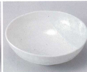
35-403-35 500円 粉引5.0鉢 (16×5.7) 504140335