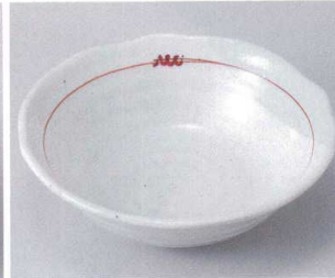
35-303-52 630円 赤結び5.5鉢 (16.5×5) 504130352