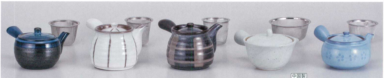
351-401-47 1,900円 黒水晶青流し急須(カゴ網付) (10.5×9.3・440cc) 534940147