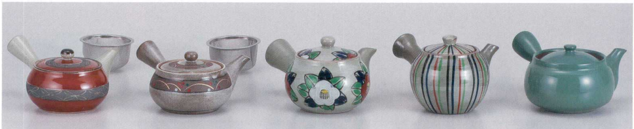
351-301-26 2,200円 赤巻金彩急須(カゴアミ付) (1.8合・280cc) 534930126