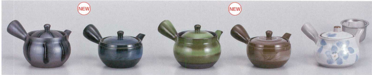
351-101-20 1,800円 美濃十草帯網急須 (9×9.5・300cc) 534910420