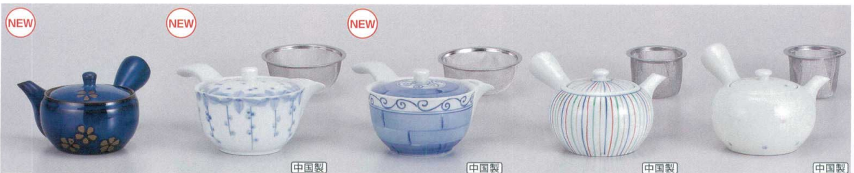
351-501-47 1,850円 花(左手)急須(カゴ網付) (11×8・380cc) 635150147